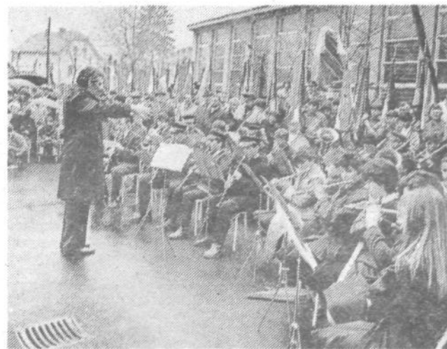
Mladi glasbeniki viške godbe so ob občinskem prazniku uspešno nastopali in bili deležni zahvale občinstva