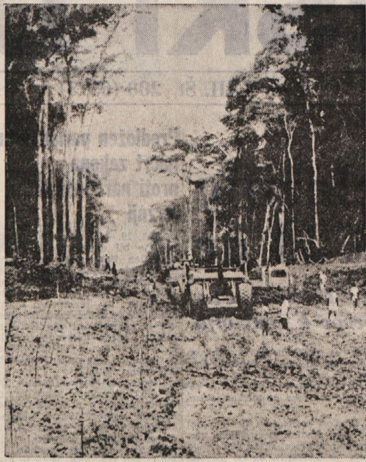
Podjetja iz raznih držav prevzema jo v manj razvitih deželah v Afriki in drugod razna dela. Gornji posnetek je iz vzhodne pokrajine Konga, kjer Italija gradi novo cesto.