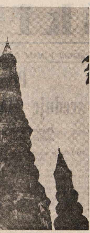
Sledovi stare Indije