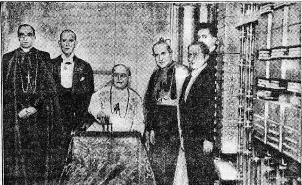
Papež odvarja novo telefonsko centralo v Vatikanu

Ko smo se peljali nazaj, je bila naša pot eno samo zmagozslavje.