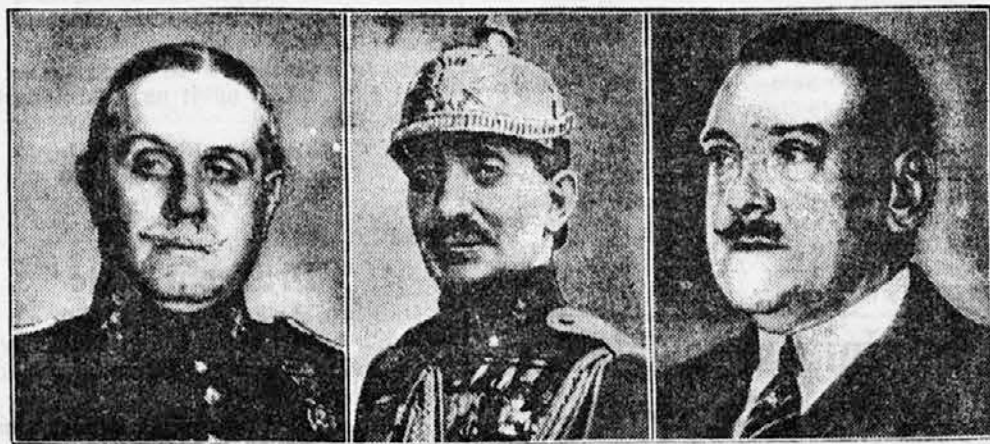
Pred novo diktaturo v Španiji

Kaj so hoteli baptisti s tem izraziti, da se pri