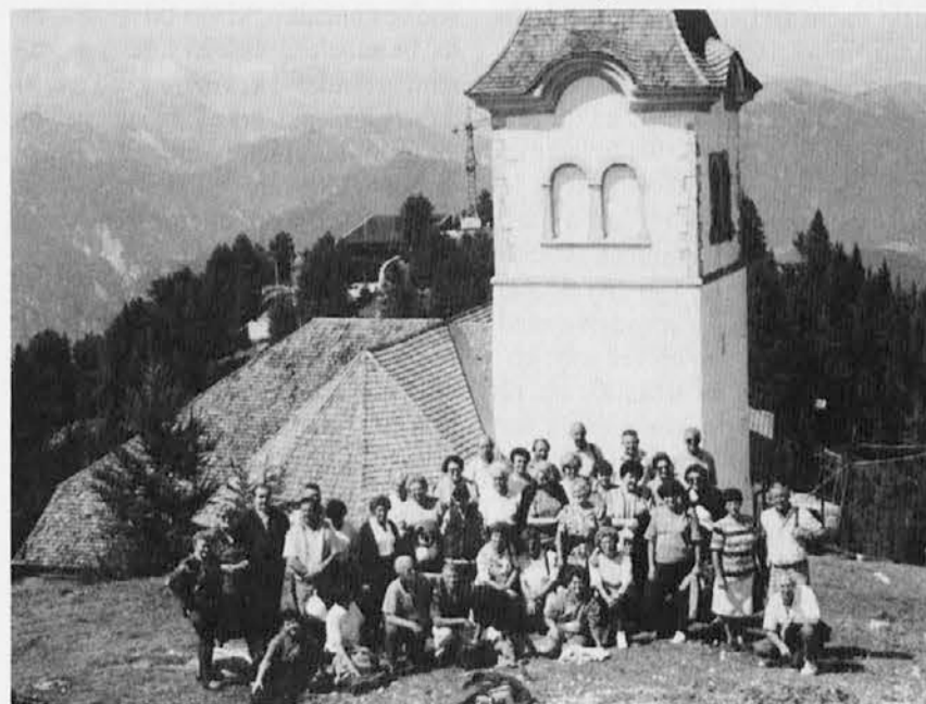
Na sliki skupina štandreških romarjev na Sv. Višarjah

Letošnje poletje je bilo s suhim vremenom zelo primerno za razna romanja, predvsem še v kraje, kjer stojijo svetišča v višjih legah. Svete Višarje so bile vedno zelo priljubljena božja pot in tudi letos jo je obiskalo veliko goriških romarjev iz raznih župnij. Zadnje nedeljo v avgustu so k Mariji na Sv. Višarje poromali tudi štandrežci. Poleg avtobusa so številni prišli z osebni-