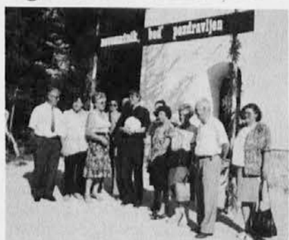
Na sliki z novomašnikom Podržajem