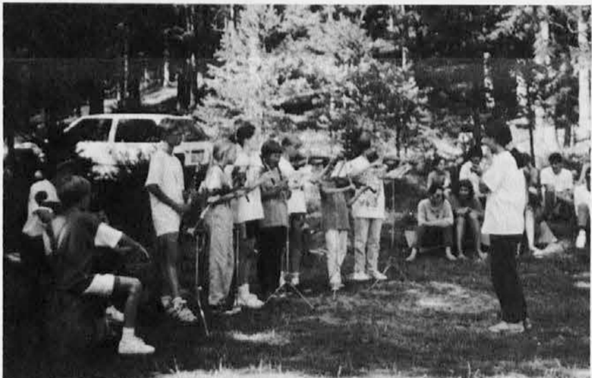
Udeleženci »Glasbe v naravi« so pred odhodom igrali za starše in goste

Letos smo se že tretjič odpravili na poletni teden »Glasba v naravi«.