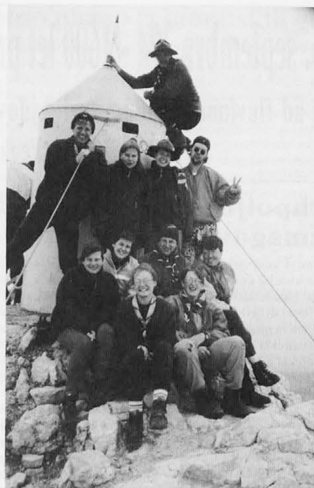
Po dolgi hoji končno na vrhu Triglava