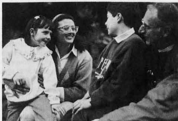
Šola igra pomembno vlogo pri vzgoji otrok. Prizadevajmo si za njeno kvaliteto.

Kaj nas lahko še čaka v novem šolskem letu, nam ni dano vedeti; vemo pa, kaj nas čaka v ne zelo daljni bodočnosti, če se bodo zadeve še nadalje tako zapletale in če se bo na-