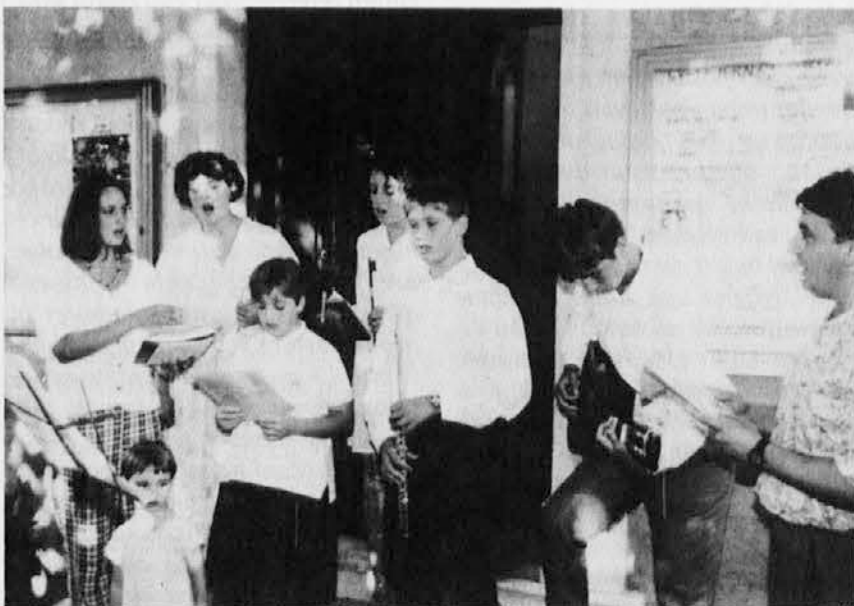
Člani družine Sečnik pojejo pred cerkvijo v Mačkoljah. Članek je na tržaški strani.

V sredo, 24. avgusta, so predstavili prvo številko novega tržaškega satiričnega tednika Wizzyricon. Prva, poskusna številka, je že v kioskih skupno s šolskim dnevnikom, na drugo bo treba malo počakati do srede septembra, ko bo list začel redno izhajati v manjšem formatu (prva številka je namreč v velikem formatu). Ime Wizzyricon je sestavljenka, ki vsebuje izraz nemškega izvora »witz« in italijansko izpeljanko iz satire.