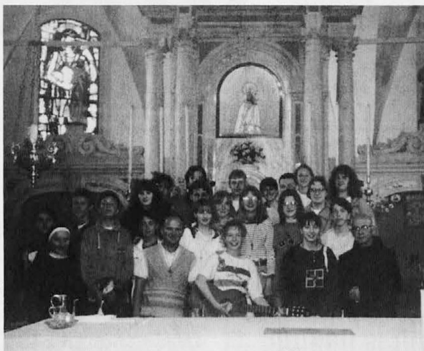
Skupina mladih na Sv. Višarjah

Brez dvoma je tudi to eden izmed razlogov, da je katoliška Cerkev vpeljala duhovniški celibat in pri njem vztraja po zgledu apostolov: vse so zapustili in šli za Kristusom.