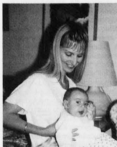
Spoštovanje pravice do življenja je pogoj za celosten razvoj.

Naravno je, da predstavljajo revni močno oviro kolonialističnim težnjam neusmiljenega zahodnega