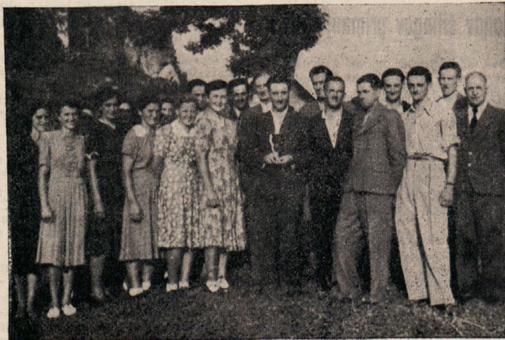
Mešani zbor Št. Ilj - Loga ves je prejel prehodni pokal SPZ

Zakaj? Iz istega vzroka. Razumemo, vse žrtve so bolesterne za prizadete, pa kdo je kriv? Kriva je vojska in ne kak posameznik. Streljalo se je neusmiljeno sem in tja, kdor je v to fronto nesel svojo glavo, je pač riskiral. Partizani so imeli še vse hujske žrtve: saj so Rute posejane z njihovimi grobovi. Še večji pa je število onih, ki jim nacistične zveri niti groba niso privoščile. V tej zvezi naj omenimo samo onih enaindvajset mučenikov, ki so bili po izdajstvu zajeti gori pri Vgrizu in do smrti izmučeni potem v Borovljah. Hude, prehude so bile te in druge žrtve za nas.