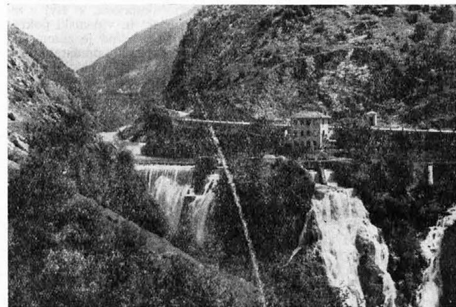
Una delle nostre fonti di energia è la centrale di Crosis in Val Torre: è una ricchezza di cui devono beneficiare anche, e prima di tutte, le nostre popolazioni.

4) Creazione nella Val Resia di una industria metalmeccanica con possibilità di occupazione di tutti i lavoratori e le lavoratrici