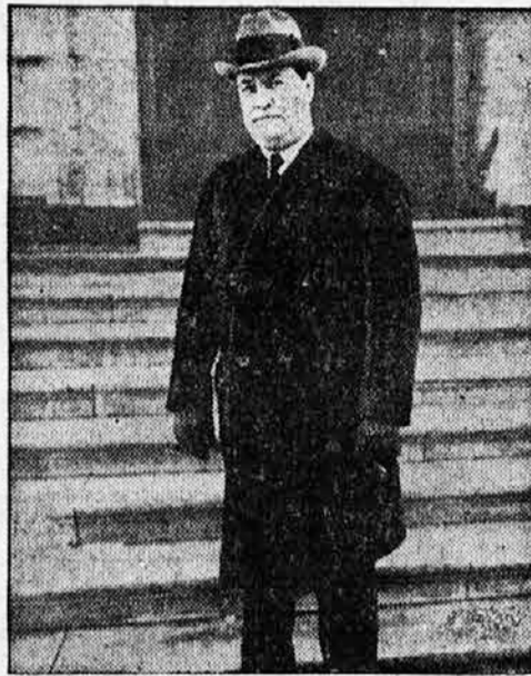
Harry F. Sinclair.

Na srečo je ostal Coxwell pri zavesti, toda svojemu tovarišu ni mogel pomagati, ker so tudi njegovi udje postali neobčutiljivi. Ker so mu otrpule roke, ni mogel odpreti ventila, pač pa se mu je posrečilo, da je v poslednjem hipu zagrabil za vrv ventila z zobmi. Komaj pa se je zrakoplov nekoliko spustil, sta oba zopet postala sveža in Glaisher je zopet lahko delal svoje beležke.