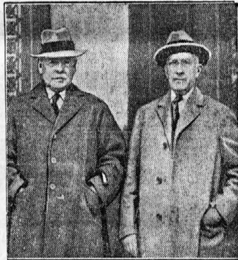
Amerika zahteva od Nemčije 40 milijonov dolarjev odškodnine.

Na raznih vabilih smo doslej dostikrat našli pripombe »promenadna obleka« in podobno. S tem je bilo rečeno, da bo zabava ali sestanek ali karkoli že bolj »domaček« in ne uradno-napeto. Na Francoskem pa je naredila moderna pokvarjena mladina še korak naprej v tem oziru. Če hoče francoska mladina povedati, da se hoče sama zabavati, tudi brez nadzorstva staršev, si napiše na vabilo dostavek: »Bagage inutile laissez sur le quai« — »nepotrebna bagažo pustite zunanaj!« Ta navada se je udomačila tudi že na Holandskem, kjer napišejo na vabilo »Geen Bagage«. Tako se vedno bolj uveljavlja pregovor, »da pusti tisti, ki ima svojo ženo res rad, svojo ženo doma.«