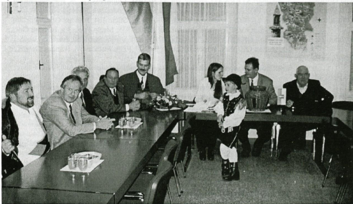
Žrebanju vrstnega reda so prisostvovali člani volilne komisije in predstavniki strank.