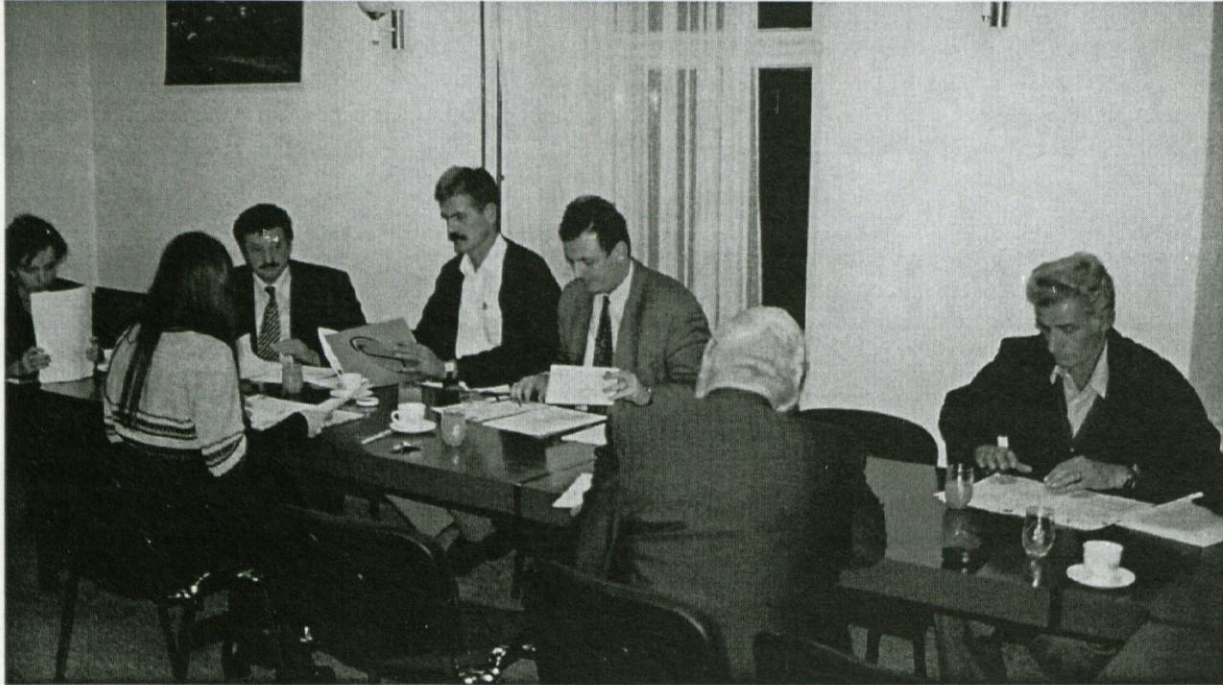
Volilna komisija je opravila res veliko, zahtevno in natančno delo.

mi kandidati na listi, in sicer ne glede na njegov vrstni red, če seveda doseže ustrezno število glasov volilcev (glasove večine volilcev, ki so glasovali za listo). Pri volitvah župana in volitvah v svete krajevnih skupnosti , za katere velja večinski volilni sistem, pa volilec glasuje tako, da na glasovnici obkroži zaporedno številko pred imenom kandidata (volitve župana) oziroma kandidatov (volitve v svete krajevnih skupnosti). Pri volitvah župana sme volilec razumljivo glasovati le za enega kandidata, pri volitvah v svete krajevnih skupnosti pa sme glasovati za največ toliko kandidatov, kolikor se voli članov sveta krajevnih skupnosti v posamezni volilni enoti. Če se na primer volijo v posamezni volilni enoti trije člani sveta krajevnih skupnosti, potem lahko volilec na glasovnici obkroži največ tri zaporedne številke pred imeni kandidatov.