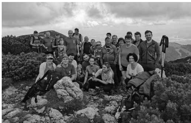
Na vrhu Korena

mivejši, smo za povratek izbrali grebensko pot preko Zvoha na Krvavec. Pri tem nas je presenetil malo zahtevnejši odsek tik pred Zvohom, ki pa smo ga uspešno premagali. V začetku julija smo se odpravili na severozahod Slovenije in osvojili 2679 m visoki Mangart. Na pot smo se odpravili z manjšim avtobusom, ki nas je pripeljal malo pod vrh Mangartskega sedla (1800 m). Vzpon smo izpeljali po treh smereh. Prva skupina je vrh osvojila po plezalni Slovenski smeri, druga po Italijanski smeri, tretja (najmanjša skupina) pa je goro osvojila po zahtevni ferati iz smeri Belopeških jezer. Prvi dve skupini sta pri vzponu in spustu premagali okrog 1800 višinskih metrov, tretja pa je pri vzponu premagala dobrih 1800 m in nato še za spust pribl. 900 m. Imeli smo čudovito sveže vreme in prav vsi smo kljub naporom na pohodu neizmerno uživali.