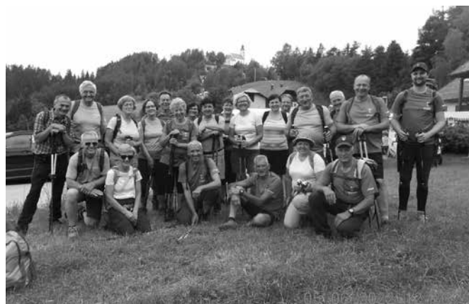
Sveti Duh na Ostrem vrhu

V juniju je potem sledilo opazovanje polne lune, zadnji vikend pa smo osvojili naš prvi dvatisočak, ki sicer ni popoln dvatisočak, saj mu do tega manjka samo en meter. Gora z imenom Vrh Korena leži v Kamniško-Savinjskih Alpah, v bližini smučarskega centra Krvavec. Da je bil pohod zani-