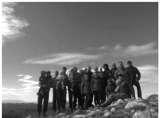
Na vrhu Snežnika

V soboto, 21. avgusta, nas je pred domom krajanov v Narapljah čakal avtobus in ob 7. uri smo odrinili na pot. Po dobrih štirih urah vožnje smo prispeli na Sviščake, našo izhodiščno točko. Gorski rekreacijski center Sviščaki leži na 1240 m nadmorske višine, kjer stoji planinski dom, nekaj počitniških hišic, pozimi pa lahko tam obiščete smučišče. Ko smo pomalicali in si pripravili opremo ter nahrbtnike, so nas presenetili črni oblaki in grmenje. Prijazen oskrbnik doma nam je povedal, da bo nevihta najverjetneje obšla našo izhodiščno točko. Zato smo se pogumno podali na pot, ki je najprej vodila mimo počitniških hišic, nato pa smo krenili na označeno gozdno pot. Ko smo prispeli do konca