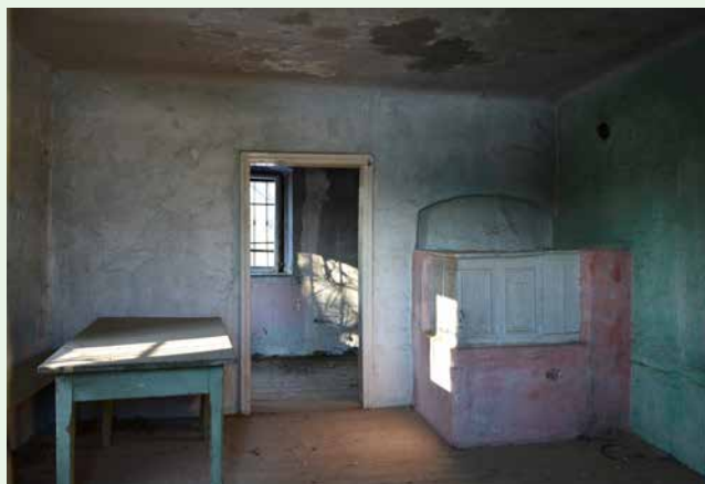
1. nagrada: Stanko Frangež