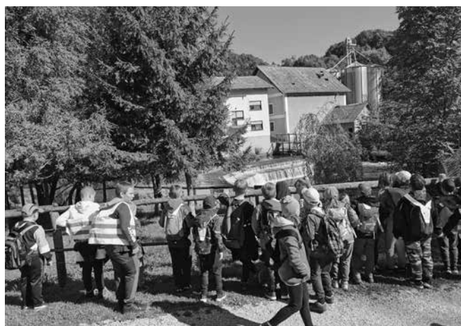
Pohod na Slape

Z veseljem si ogledujemo zeleno okolico naše podružnice,