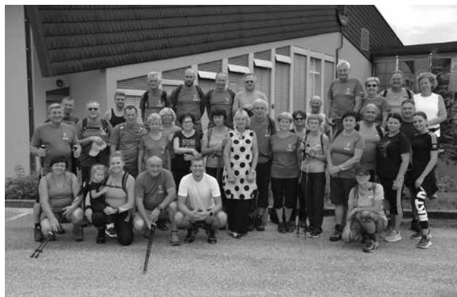
Pohod Spoznajmo občino peš

V drugi polovici julija smo se ponovno odpravili v visokogorje, v neposredno sosesčino našega očaka Triglava. Naš cilj so bili vrhovi okrog Staničeve kočje. Tura je bila dvodnevna, vzpon do kočje pa smo opravili po zahtevni Tominškovi poti, ki je speljana pod ostenjem Cмира. Do kočje smo prispeli sredi dneva, nato pa po kratkem počitku popoldne v dveh ločenih skupinah osvojili dva vrhova. Manjša skupina je po daljši zahtevni poti osvojila 2532 m visoko Rjavino, večja pa se je podala na bližnji Begunjski vrh (2461 m). Drugi dan smo se ponovno razdelili v dve