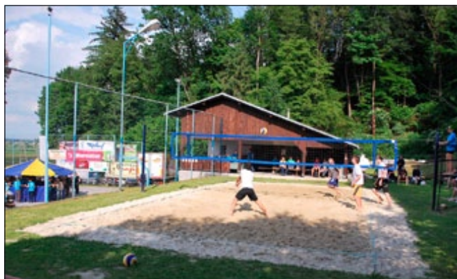
Odbojkarji v akciji