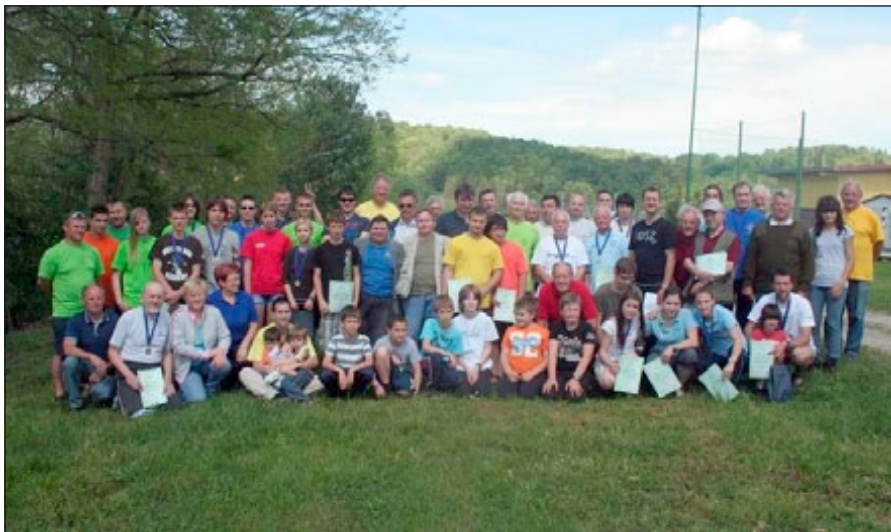
Udeleženci tekmovanja v Majšperku