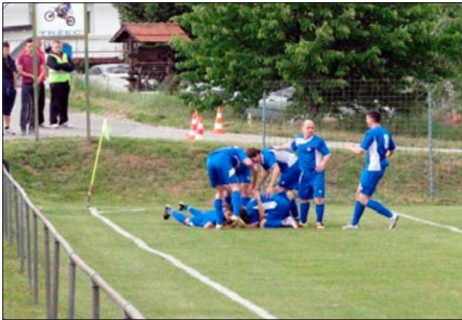
Veselite se zadnjem zadetku NK Majšperk v sezoni 2011/2012

znašli in smo bili tudi dobro sprejeti s strani domačinov. Naši fantje so še naprej igrali odlično in so nas še kar naprej razvajali z zmagami. Tudi ekipa Tržca je igrala odlično in obe ekipi sta pričakovali napako druge ekipe, pa si napake ni privoščila nobena ekipa. Prišel je dan odločitve, 2. junij 2012. Ob 17:00 se je začela drama za prvaka druge lige MNZ-Ptuj. Ko je ekipa prišla na igrišče, ki ne ustreza minimalnim pogojem za igranje velikega nogometa, smo vedeli, da bo to boj za vsako žogo in v tem primeru so bili domači-