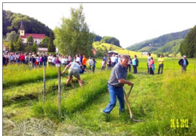
Košnja na stari način

sti košnje, kleščanja hloda, spretnostno podiranje hloda na balon, prijetna glasba ansambla v živo, zanimiv kulturni program domačih kulturnih in folklornih društev, šaljivi skeči, prepevanje pevskih skupin, razglasitve rezultatov po predhodnem ocenjevanju vina in suhomesnatih izdelkov, podelitve priznanj in nagrad natečaja za najlepše urejeni dom in kmetijo, vabljeni pomembni gostje lokalnega značaja in širše, nagovor ge. županje, kontinuirana slikovna predstavitev utrinkov s preteklih