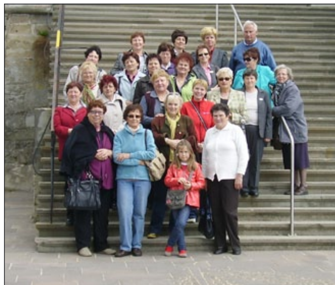
Klepetulje iz Majšperka in Galicije