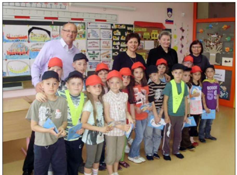
Mladi člani RK

smo s skupnimi akcijami zbirali star papir ter plastične zamaške. Tako smo pomagali zbirati denarna sredstva za tiste, ki potrebujejo tovrstno pomoč. Velikokrat pomagamo starejšim ljudem. Naše babice in dedki potrebujejo našo pomoč, našo ljubezen in naš nasmeh. Veliko je ostarelih in osamljenih. Tudi mi smo jih pomagali razveseliti. Izdelali smo novoletne voščilnice, tako da jim