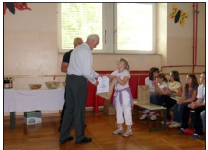
Na podelitvi nagrad