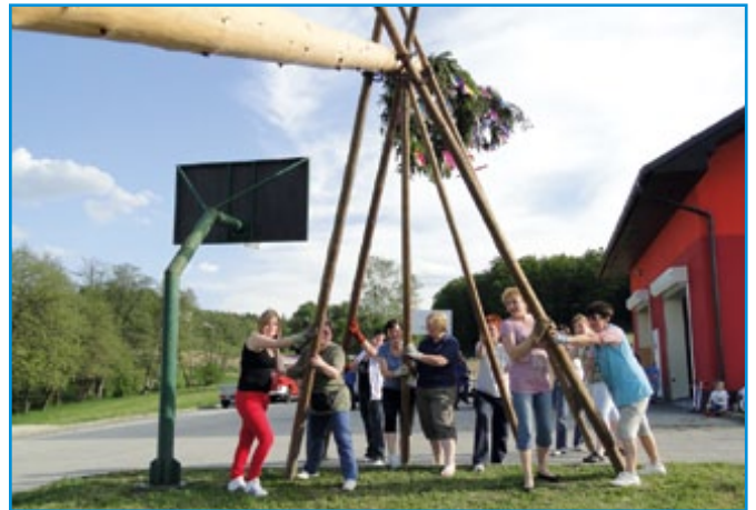
Gasilke na Medvedcah so postavljale majsko drevo, več na strani 17