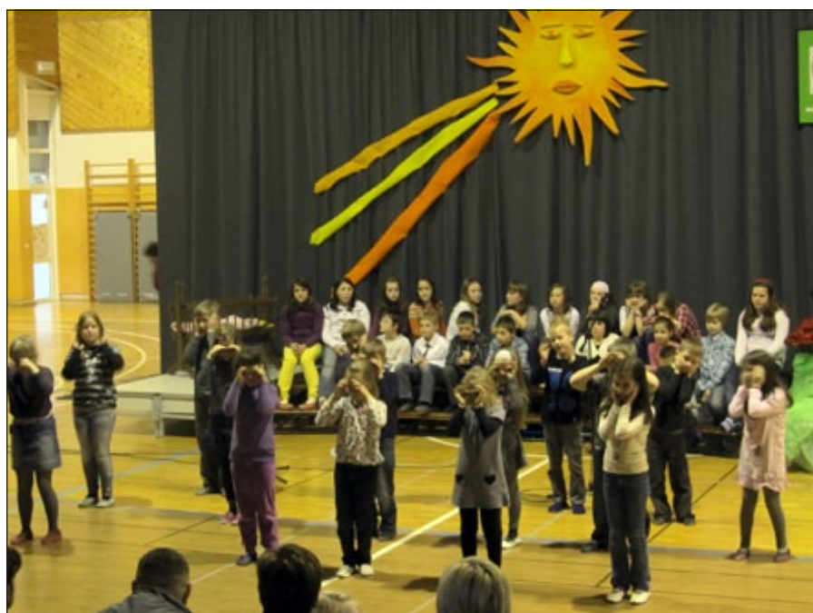
Utrinka s prireditve

Prireditev Pozdrav pomladi je bila namenjena ob dnevi žena in materinskem dnevu. Nastopali so otroški in mladinski pevski zbori, med njimi tudi podružnice Stoperce in Ptujška Gora ter vrtec. Igrali so tudi na različna glasbila. Na koncu prireditve smo dali mamicam in babicam rdeči nagelj.