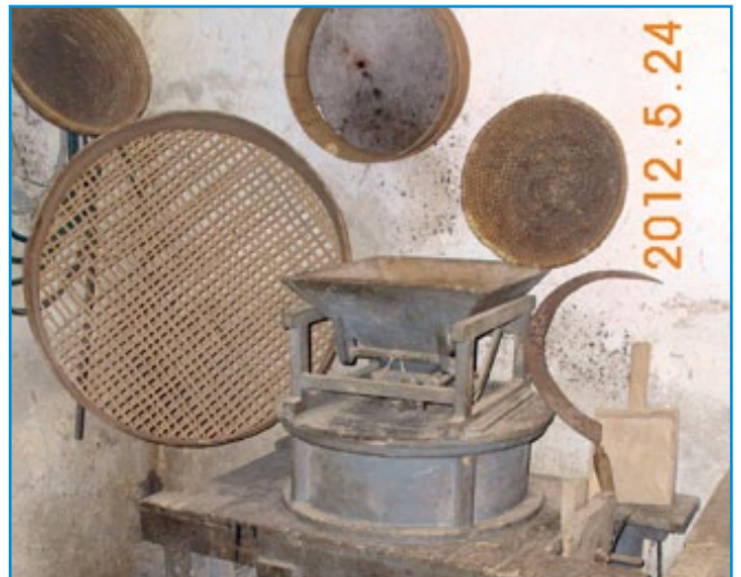
V Stopercah so k življenju obujali stara orodja, več na strani 10