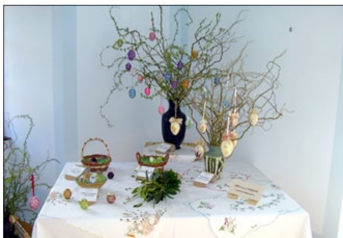
Del razstavnega prostora