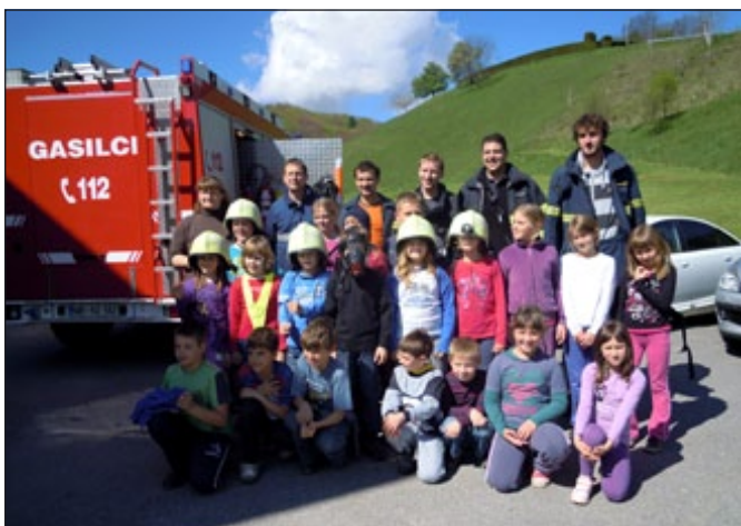
Učenci OŠ Stoperce na gasilski vaji