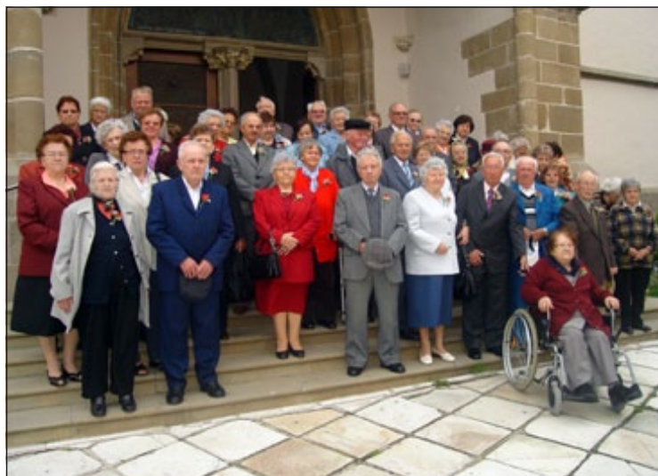
Starejši občani pred baziliko na Ptujski Gori