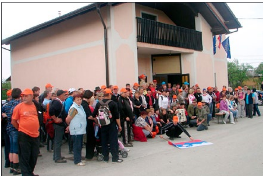
Pohodniki pred Domom krajanov Sestrže.

Na tem mestu bi se z njim tudi strinjala. Nekoč je zapisal tole poved: »Ukiniti 27. april kot državni praznik in dela prost dan bi bilo dejanje barbarstva!« A najprej na začetek. Že osmo leto zapored se 27. aprila – dan, ki mu ni para v zgodovini – organizira »partizanski« pohod iz Škol s ciljem v kraju Pečke. Pohod je po zbiranju pri Kurežu krenil ob 9.00 uri zjutraj. Pot pa je pohod vodila čez Pongrce, Jablane, »gmajne« in vse do Sestrž, kjer so bili naši pohodniki s strani »Zgornjega kota« Sestrž obilno