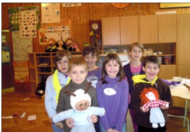
Ob projektu Groznovilnica