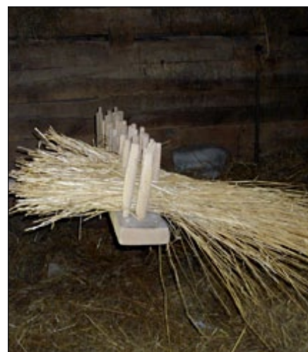
Spomin na delo v preteklosti