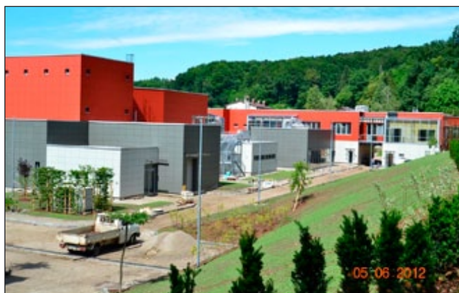
Takole dobiva končno podobo KPC Majšperk

financira Evropska unija, in sicer iz Evropskega sklada za regionalni razvoj. Operacija se izvaja v okviru Operativnega programa krepitve regionalnih razvojnih potencialov za obdobje 2007-2013, razvojne prioritete »Razvoj regij«, prednostne usmeritve »Regionalni razvojni programi«. Sofinancerska sredstva so v deležu 85% namenska sredstva Evropske unije, Evropskega sklada za regionalni razvoj.