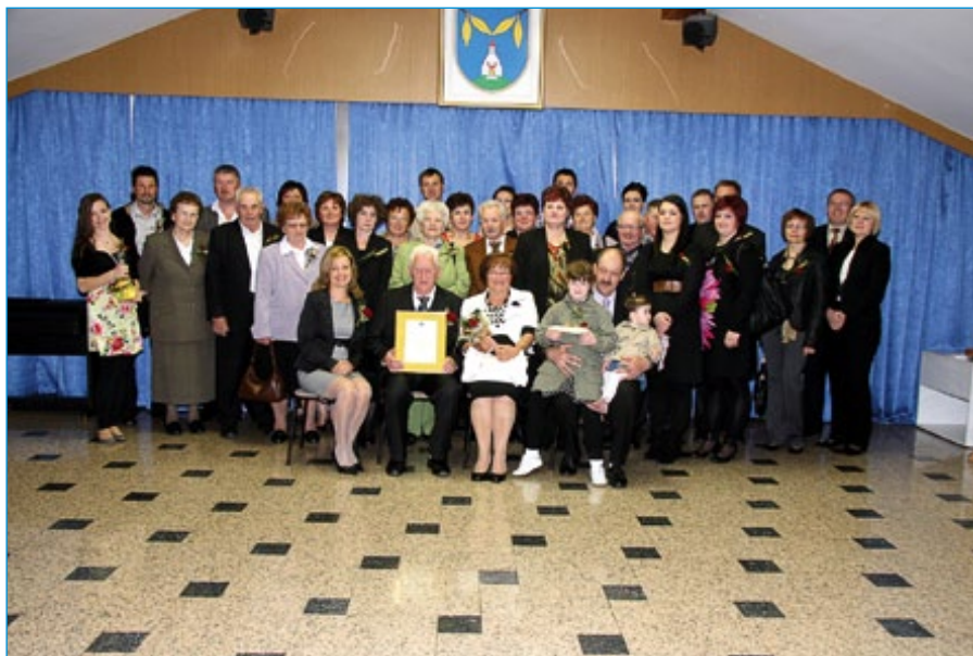
Zlatoporočenca s svati