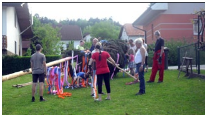
Okraševanje prvomajskega drevesa.