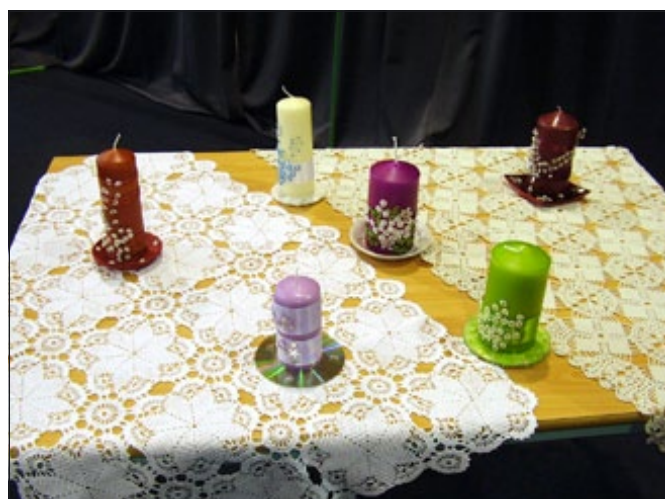
Sveče, okrašene s perlami

ske večere. Nizale, zvijale, šivale, prepletale, vozale smo perle v različne oblike in jih prenašale na različne materiale. V igri s perlami so tako nastali številni izdelki. Največ med njimi je okrasnih sveč, namenjenih različnim priložnostim, voščilnic, nakita, okraskov na oblačilih, zavesah, prtičih. Tudi velikonočne jajčke pred nami niso bile varne. Kljub temu, da smo letos posebno pozornost posvetile perlam, se