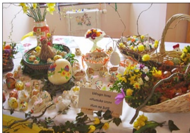
Velika noč pri naših sosedih