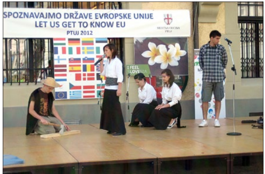
Utrinek s predstavitve OŠ Majšperk v Ptujju