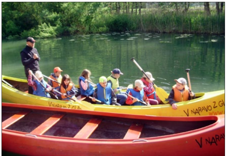
V naravi je lepo