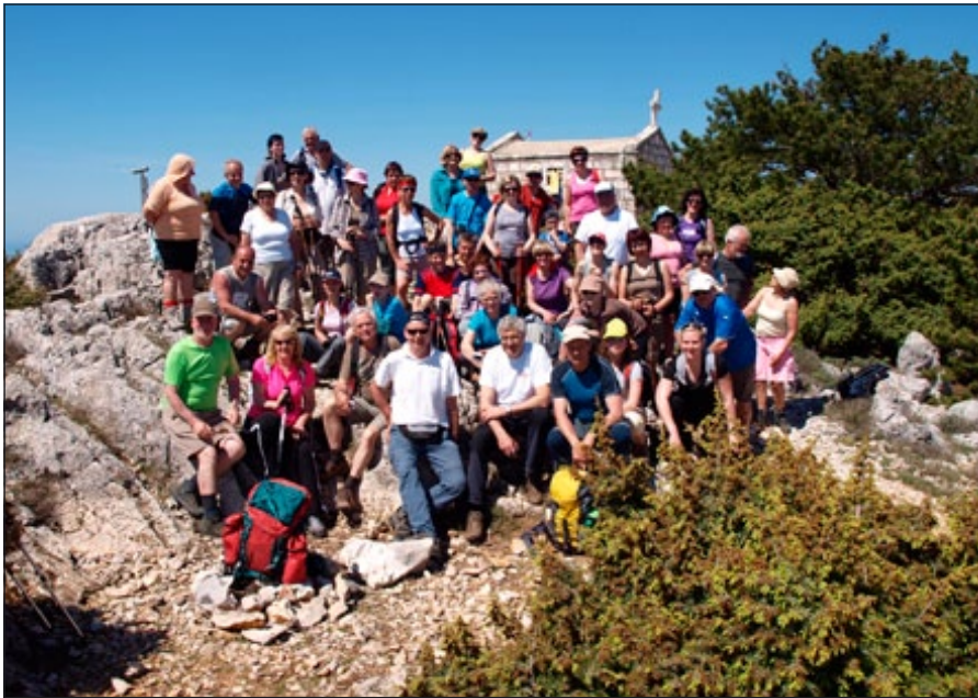
Na vrhu Lošinja – Televrin

urah hoje vrnili do avtobusa in nato domov. V marcu smo člani prehodili še Atilovo pot od Radencev na Kapelo in nazaj ter nadaljevali z luninimi pohodi. Aprila smo na velikonočni ponedeljek prehodili del prekmurske planinske poti od Zavrha do Svete Trojice, kjer smo uživali v spomladanskem soncu in si na koncu ogledali še Trojiško jezero, cerkev in razstavo velikonočnih pisank. Konec aprila smo naše člane popeljali na potepanje po Cresu in Lošinju, kjer smo prvi dan prehodili otok Cres od severne obale Valun- preko otoka do slikovitega mesteca Lubenice, ki obisko-