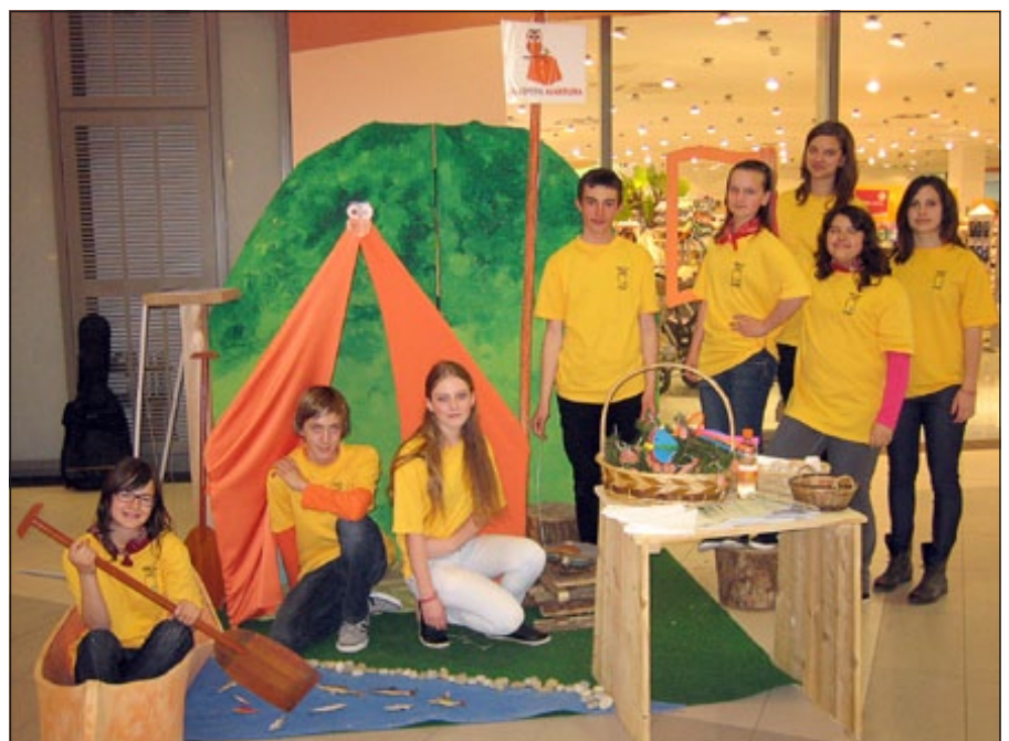
Učenci OŠ Majšperk ob predstavitvi turističnega projekta