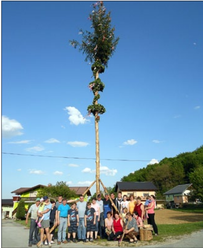
Majsko drevo na Dvoršni

Tradicija praznovanja 1. maja je med občani Dvoršne že globoko zakoreninjena, zato se tega dogodka zaradi nobe-