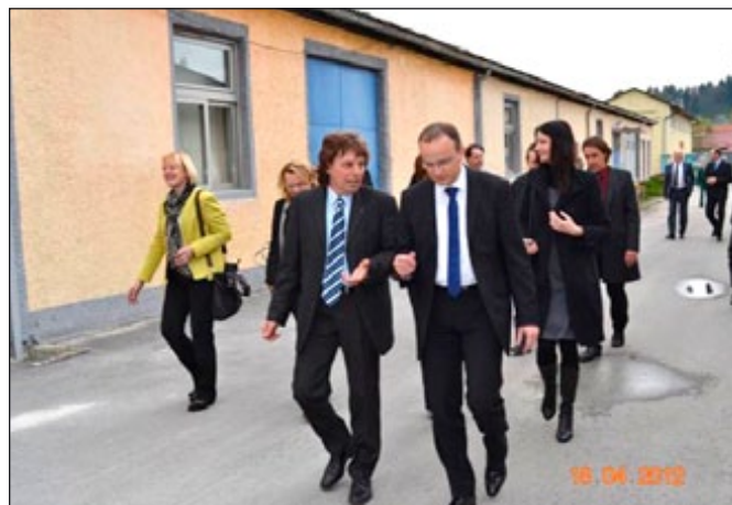
Predstavniki vlade so obiskali tudi podjetje Albin Promotion