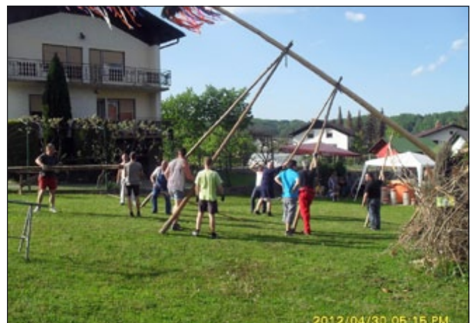
Utrinek iz postavljanja prvomajskega drevesa pri »ranču na Bregu«

Vemo, da nobeno srečanje ne sme potekati brez dobre kapljice in brez hrane, zato je bilo poskrbljeno tudi za to.