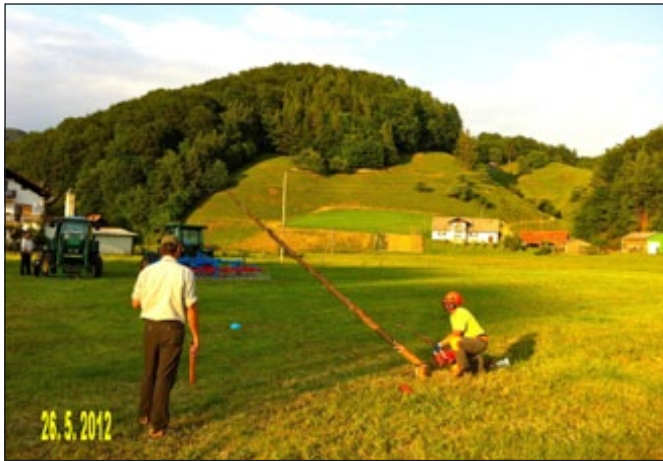
Podiranje dreves z motorno žago