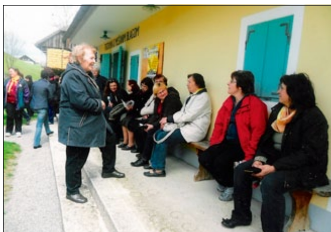
Gospodinje v prijetnem klepetu

Pogled na Donačko goro, ki je bila obsijana s soncem, z druge strani pa je prihajal dež, je bil naravnost pravljichen. Prav tja pod njo smo bile