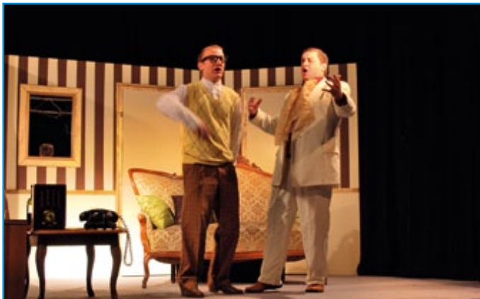
Velik gledališki uspeh društva SmoTeater, več na strani 19