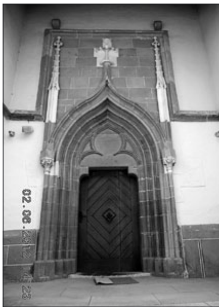
obrt na Ptujski Gori nekoč, prihodnje leto pa ... o tem pa v napovedniku v

Svoj domači kraj preprosto moraš imeti rad. Spomine na svoje prednike, otroštvo, lepe in žalostne trenutke družine, kraja, posameznih dogodkov nosiš v srcu in jih ne pozabiš ... O Ptujski Gori se je že od nekdaj veliko pisalo. Največ zaslug za to ima »biser slovenske gotike«, kot je baziliko poimenoval F. Stele, a še vedno je ostalo veliko neraziskanega, nenapisanega. Na Gori je bilo zanimivo družabno, društveno in politično življenje, nešteto obrti, ki so oskrbovale domačine, in preko trgovine tudi kraje današnjih sosednjih držav. Prav zaradi tega, da se zavemo pomena ohranjanja naše naravne in kulturne dediščine in da smo ponosni na svoj kraj, je nastala ideja za ciklus razstav »Strici so mi povedali« o obrtnih aktivnostih kraja nekoč. V letu 2012 bomo predstavili kamnoseško