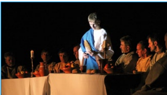
KPD Stoperce je vabilo na ogled pasijona, več na strani 21