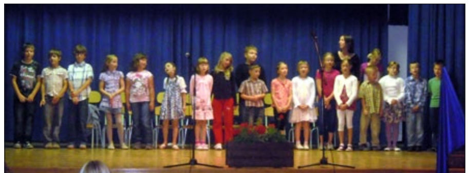
Učenci na zaključni prireditvi

Radi imamo glasbo, zato smo se odločili, da jo podrobneje spoznamo. Tako smo preko zgoščenk in računalnika