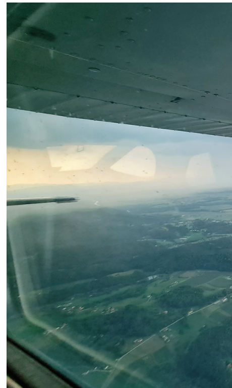
Letenje med nevihtnimi oblaki je