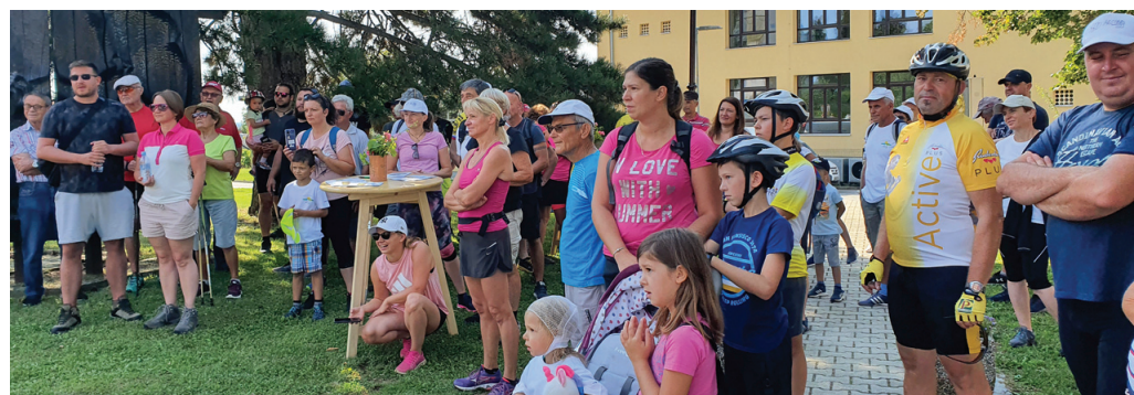
Še zadnja navodila pred odhodom na pot po poteh, ki odkrivajo lepote in skrivnosti Koga.