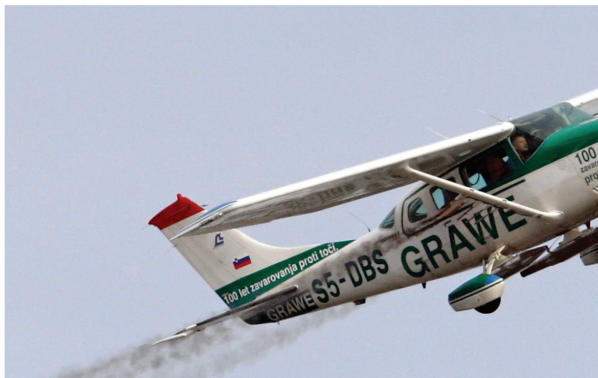
Protitočno letalo je letos med oblake poletelo že 16-krat.