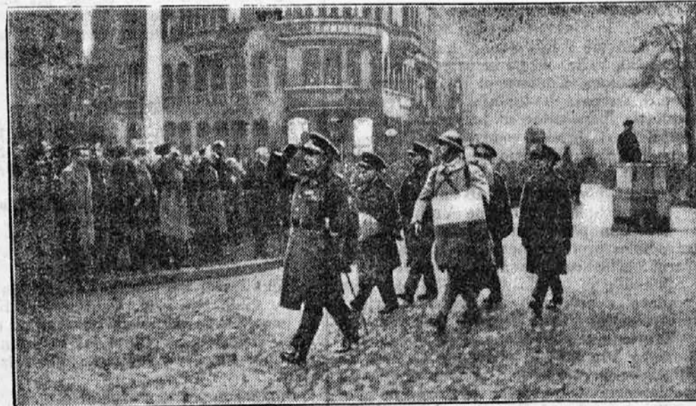
Železniška straža zapušča Posaarje.

Nadškof Soederblom in bivši ameriški državni tajnik Kellogg sta dobila Nobelovi mirovni nagradi za l. 1930 in za l. 1929. Slavnostni govor ob podelitvi nagrad je govoril norveški minister za zunanje zadeve, nagrade pa je podelil norveški kralj Haakon VII.