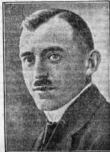
Sedem dni in noči živ pokopan.

Na gospodinjo na ladji se pa ne obračajo le siromašnejši potniki tretjega razreda, ampak tudi bogati potniki prvega in drugega razreda, zlasti ženske. Gospodinja na ladji mora znati in vedeti vse, kar se na ladji dogaja, in mora znati vedno svetovati to, kar je v tem ali onem slučaju treba. Na ladjah se n. pr. dostikrat rodi kakšno dete, mati pa nima potrebnega perila. Takrat začne gospodinja takoj zbirati dobrovoljne darove in stvar je v redu. Kaka gospodinja pa pripoveduje sama, kako je bilo, ko je bila v službi na neki »ladji za nevestec. Ladja je namreč vozila v Kanado vedno dosti mladih žensk, ki so se hotele tam poročiti, ne da bi bile še kedaj videl svojega ženina. Ta dekleta so si predstavljala tamkajšnje življenje navadno tako, kakor so ga videle v filmu. naloga gospodinje pa je bila, da jim pove resnico, da dekleta ne bodo preveč razočarana. Ko pa so dekleta zvedela od gospodinje, da jih čaka v Kanadi trdo delo in trdo življenje in ne samo veselje in razkošje, so se nekatera tako prestrašila, da se z ladjo niso hoteli več iti in je bilo zelo težko jih pregovoriti, da so stopila na kopno, kjer so že nanje čakali njihovi, dotlej še neznanji ženini. Enkrat pa je potovalo na to ladjo več sto potnikov, ki so pripadali 24 narodnostim in lahko si mislite, da ni tako lahko in enostavno vzdrževati med tako različno množico red.