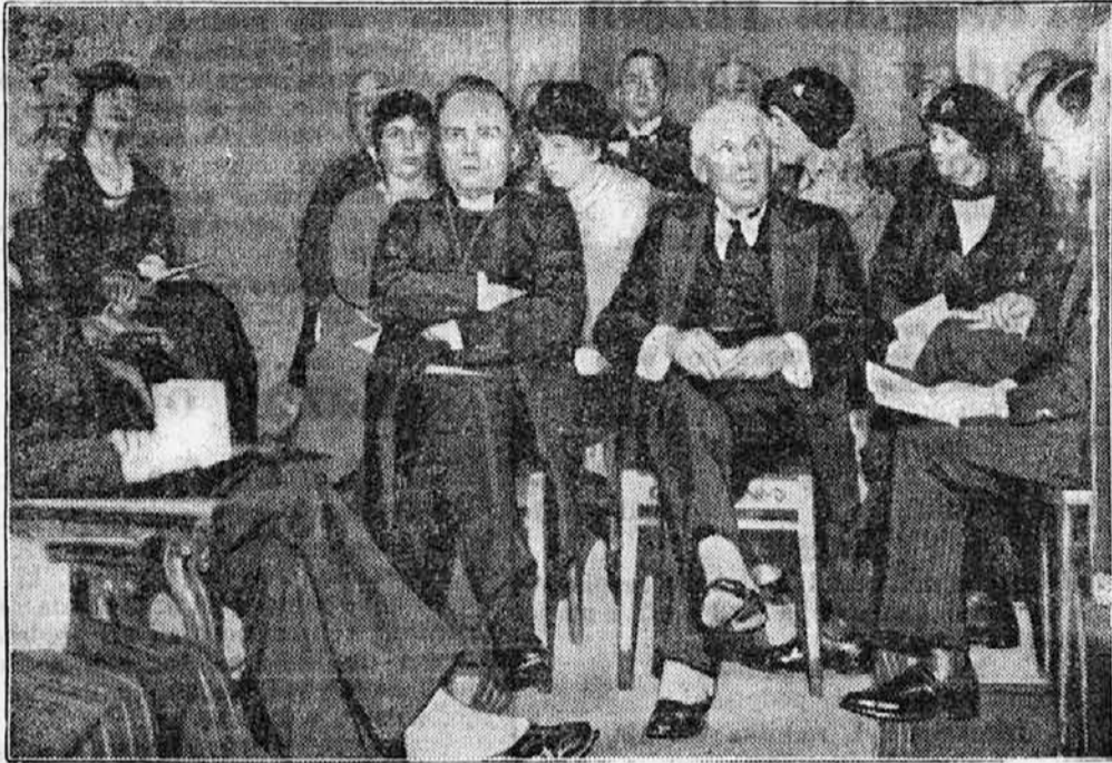
Razdelitev Nobelovih nagrad.

Prejšnja pokolenja so imela svoje »muhe« ali pa sitnosti — mi pa imamo le »komplekse«. Nekdaj so fantje imeli svoje ljubice, mi pa poznamo samo »objekte seksualnega hotenja« — kaj hočemo? Samo da je škatljica nova, da izgleda »znanstveno« in da je »elegantna«. — Kaj je v škatljicah in drugih ovojih, je pa vseeno