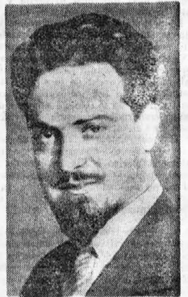
Italijanski minister za letalstvo Italo Balbo.