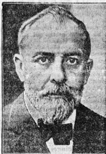
Novi francoski ministrski predsednik Théodore Steeg

Pariz, 15. decembra. AA. Minister za finance Germain Martin in minister za proračun Palmade sta izjavila novinarjem, da bosta izgotovila nov proračun v popolnem soglasju in pravočasno. Proračun za leto 1931-32 mora sloneti na strogem ravnovesju. To ravnovesje je pogoj glavne finančne politike. Finančni položaj je sicer dokaj resen, vendar ni treba obupati nad bodočnostjo. To velja tudi za primer, da se bo položaj poslabšal. Svojo izjavo sta zaključila s pohvalo bivšemu ministru finance Reynauldu, ki je vodil svoj resor sila preudarno.