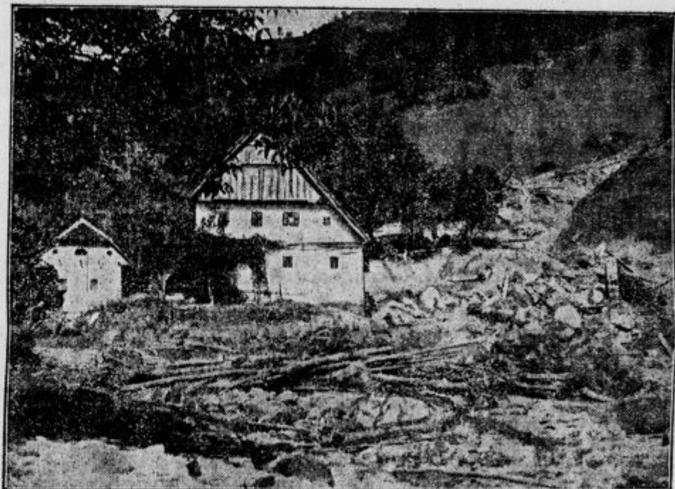
Povodenj v Polhovem gradu. Zemeljski plaz v Mačkovem grabnu.

čakovanega uspeha. Nekatere pokrajine se sploh odtegujejo zavarovanju pri državnih ustanovah in se rajši obračajo na privatna društva. Iz tega položaja misli kmetijsko ministrstvo najti izhod v preureditvi dosedanjega zakona, ki naj bi se oslonil na novo osnovo zavarovanja. Najprikladnejše zavarovalne ustanove bi bile državne ali mešane, pri katerih bi bila odrejena stroga državna kontrola. V tem oziru bi moglo služiti za vzor zavarovanje, ki ga je Bavarska uvedla 1884. l., ki je bilo potem tekom časa zelo izpopolnjeno. Bavarska je vpeljala drž. zavarovanje. Četudi je ta dežela zelo podvržena vremenskim škodam, vendar ni nosila nobenih doplačil, ker so premije same pokrivalo škodo.