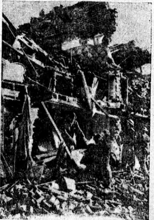
Razvaline v Londonu

— Ali greš z menoj v kino, tako rada bi videla film »Večna ljubezen«. — Ne, draga moja, čez dve uri že odpelje moj vlak! — Kot nalašč, dragi moj. »Večna ljubezen« traja samo poldrugo uro!