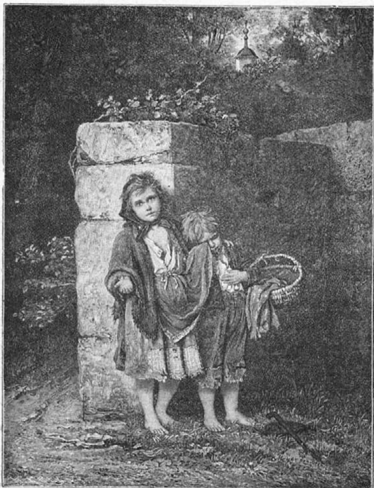
„Lačna sva in zebe naju“

Napeto so poslušale deklice in težak kamen se jim je odvalil od srca. Takoj so začele izbirati trikrat po dve, pa jim ni šlo od rok. Vsaka je hotela biti izvoljena. Nazadnje je morala odbrati sestra predsednica.