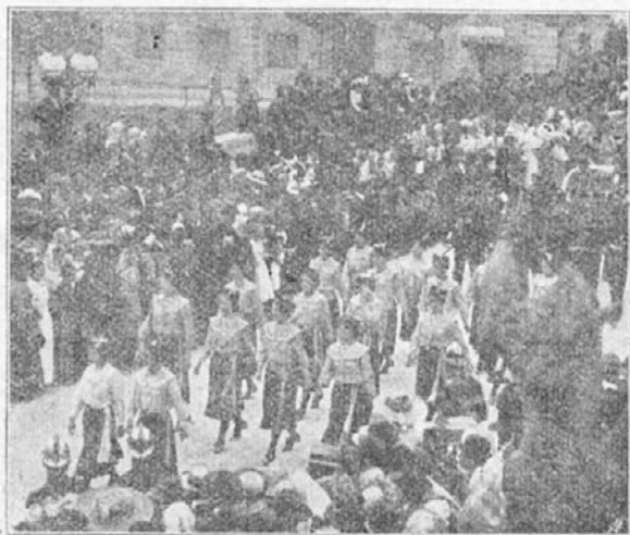
Češke „Orlice“ v Ljubljani 1. 1913.

Skušajte jih tudi pri vas posnemati. Če se vam bo obneslo, pišite „Orliču“, da bodo zvedeli drugod. Na Češkem tudi be-