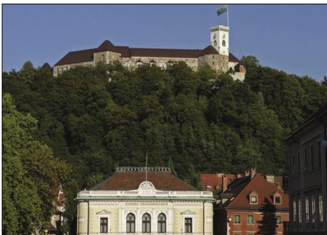
Krau Ljubljane je grad na bregej

zakaj eške fusbalski navijači (szurkoló) v Ljubljani njau na svoje zastale namalajo, nam povej indašnja pripovejst: