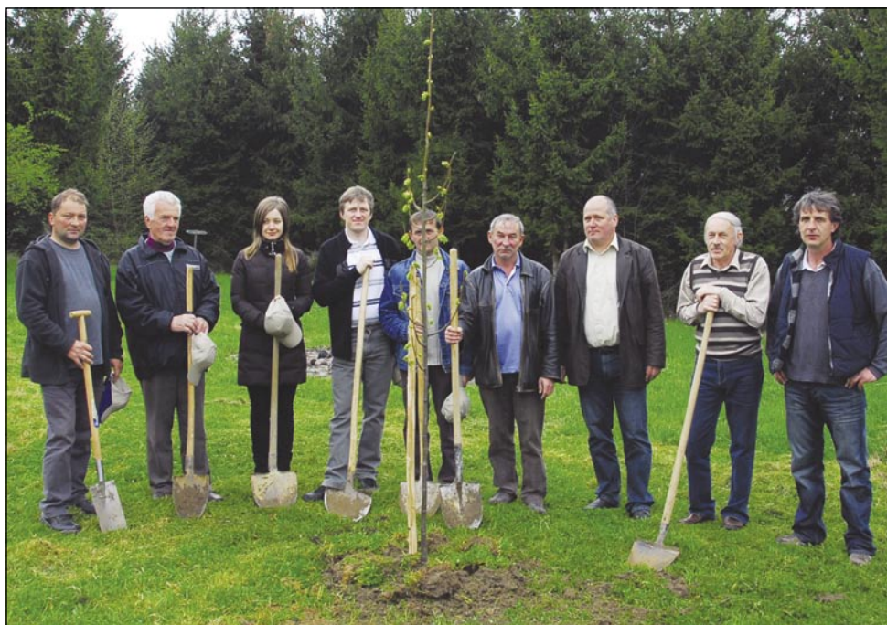
Vsakša manjšinska samouprava je posadila svojo djablan, posadila se je pa lipo tó

»Simbol naše krajine pri Dravi je djablan. Steli smo eden tau našoga žitka pripelati v Porabje, pa smo se odlaučili za stare fajte djablani. Nücali smo eške nika, nikši simbol, zatok smo s seuw pripelali eške edno lipo v Andovce, gde že stogi Mali Triglav. Vsikša djablan je ovaške sorte, ka so vesnice v Porabji tó