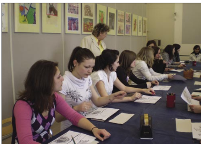
V Slovenskem etnografskem muzeju

Robbov vodnjak je največji in najlepši vodnjak v Ljubljani. V stari Ljubljani je bil vodnjak treh kranjskih rek. Te reke so: