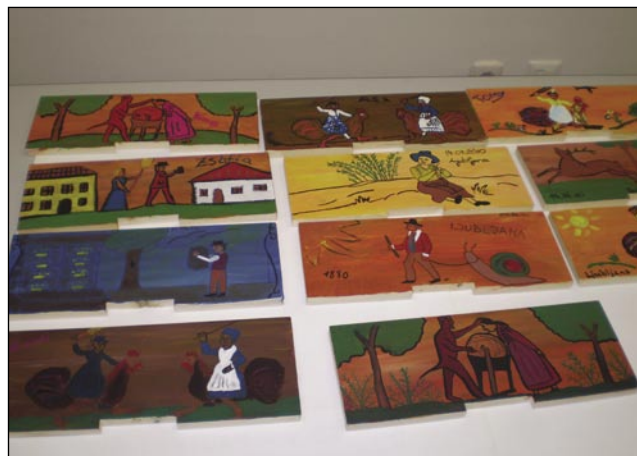
Pripravili smo panjske končnice