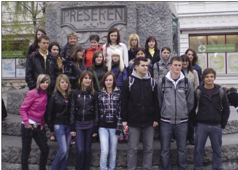
Naša skupina pred Prešernovim spomenikom

V imenu vseh udeležencev bi se rada zahvalila Ministrstvu