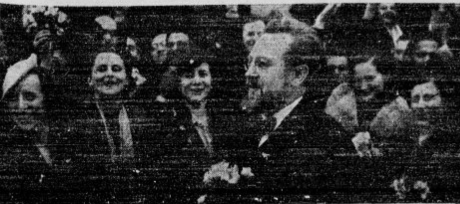
Bolgarski pevski zbor »Rodna posem« je prišel v Ljubljano, kjer je imel velik koncert. Bolgarske pevce so povsod navdušeno sprejeli. Naša slika je narejena na ljubljanskem kolodvoru.