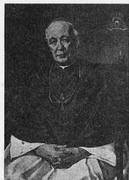
Božidar Jakac: Portret pokojnega nadškofa dr. Jožefa Pogačnika

Kako širok je bil lugled pok. ljubljanskega nadškofa Jožefa Pogačnika ne le v ljubljanski nadškofiji in v Sloveniji, marveč tudi izven meja Slovenije, se je zgovorno izkazalo v dneh njegovega zadnjega odhoda tja do veličastne in obenem preproste ter občutene pogrebne liturgije v nabit polni ljubljanski stolnici v petek 28. marca dopoldne.