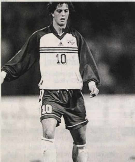
Najboljši slovenski nogometaš Zlatko Zahovič