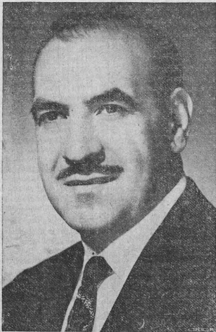
ANTHONY J. CELEBREZZE

Pri volitvah župana, ki jih bomo imeli v Clevelandu prihodnji tork 3. novembra, je upoštevati eno izredno pomembno okolščino. Kakor znano, so republikanci nedavno pri izrednih volitvah v državi Wisconsin, kjer se je v kongresnem okrožju volil nov član spodnje zvezne zbornice, klaverno pogoreli. V dotičnem okrožju, čigar volilci niso v preteklosti še nikoli prej izvolili demokrata, je z odlično večino glasov zmagal kandidat demokratske stranke. To se je zgodilo, ker so farmerji in delavci dotičnega okrožja po manj kot desetih mesecih spoznali, da so bile fantastične obljube republikancev pri lanskih predsedniških volitvah ogromna prevara. Volitve v Wisconsinu so temeljito razblinile spretno negovano iluzijo, da bo general Eisenhower kot predsednik delal čudeže—skril davke, zvišal dohodek, "osvobodil" trgovino, skratka, da se bosta v Ameriki cedila med in mleko, le da se demokrate poženejo z vlade v Washingtonu.