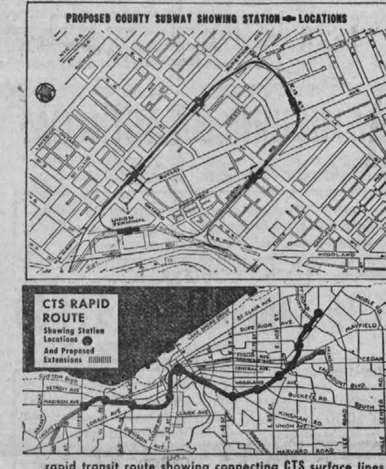
Diagram above shows route of the proposed county subway loop. Rapid Transit trains from the east and west will run to the Union Terminal, then will proceed around the subway loop to distribute passengers at four additional stations. These will be at East 9th-Huron-Prospect; at East 13th and Euclid; at East 9th and Superior and at Superior and Public Square. Map below shows the route of the CTS Rapid Transit lines

FOUR ROOM CO-OP APARTMENT Children welcome. In 4 apartment building across from school; near Elevated and CTA transportation; gas heat; cabinet kitchen; storm-screens; tile bath. $2,500 cash will handle. Monthly assessment $73.00; all included. Call AUSTIN 7-1253