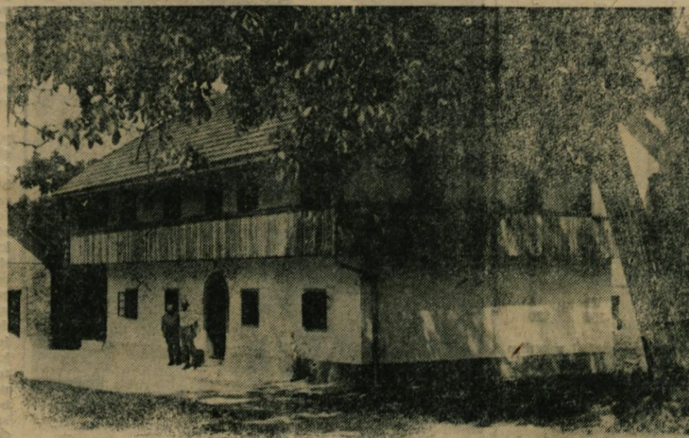
Obnovljena Golobova hiša v Mekinjah je okras vsej okolici