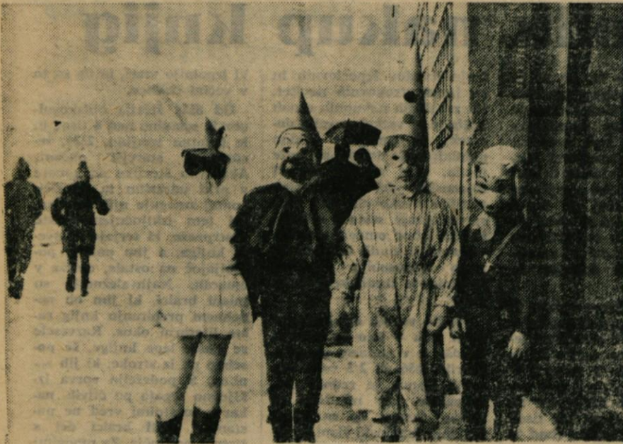
Kljub snežnemu metežu je bil letošnji pust vesel. Sneg tudi najmlajših maškar ni mogel ugnati