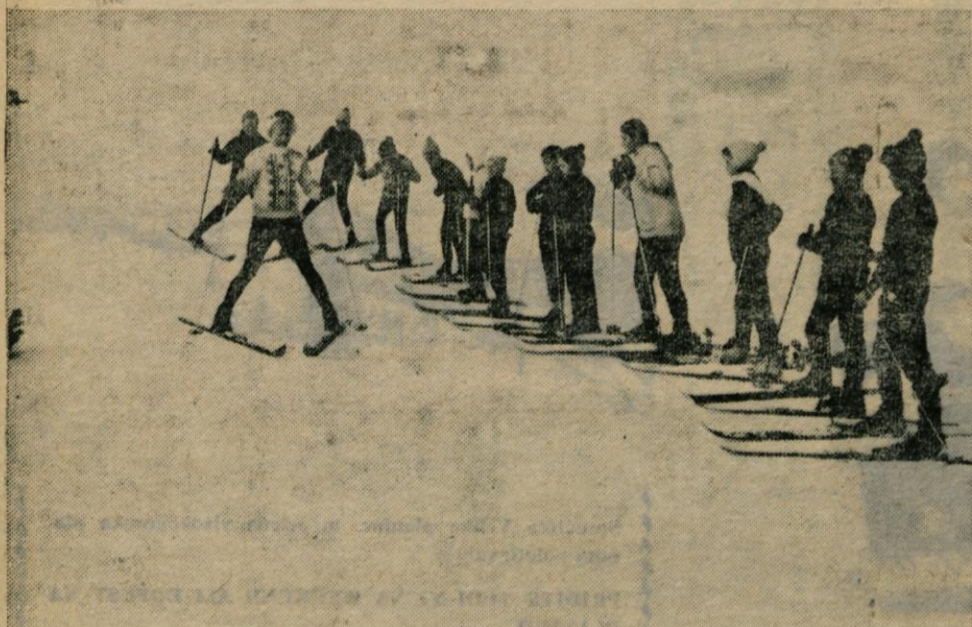
Mladi smučarji na Zelenem robu pozorno spremljajo navodila svoje učiteljice