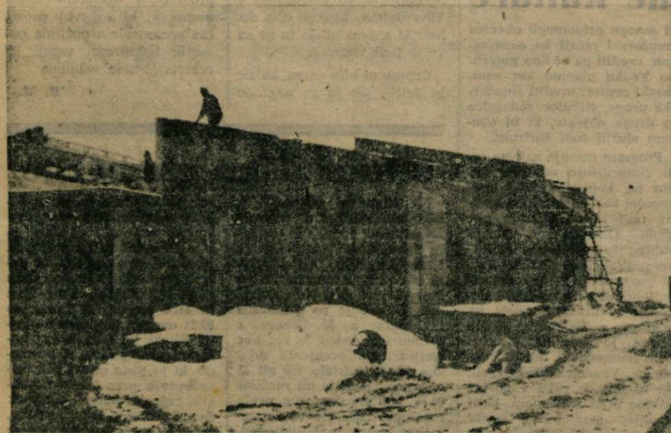
Gradnja osnovne šole v Komendi: Ali res ni bilo mogoče telovadnice pokriti preje kot šele januarja, sprašujejo občani. Zidovom dež res ni najbolj koristil, za tako ugotovitev ni treba biti poseben strokovnjak. Kaj pravi k temu Projekt Kranj?