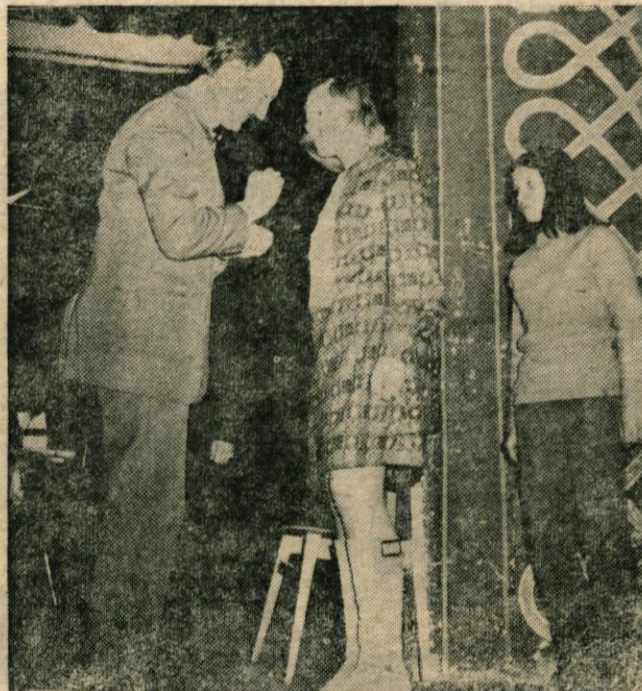
Predsednik občine je dvajsetim najboljšim tekmovalcem podelil zlate Prešernove bralne značke

Interesenti naj vloge pošljejo na gornji naslov. Vlogi naj priložijo zadnje šolsko spričevalo in potrdilo o premoženjskem stanju. Podrobnejše informacije lahko dobite v tajništvu podjetja.