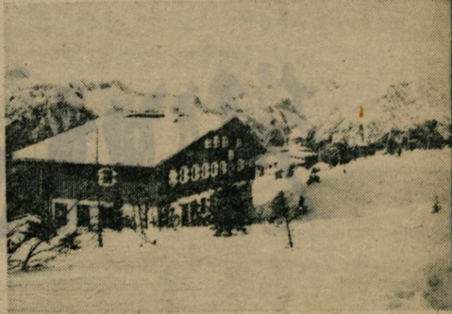
Smučišča Velike planine, in zelena visokogorska planota poleti, vabijo

Po Ljudevitu Stiasnyju so poimenovali eno od novih ulic na Zapriškem polju.