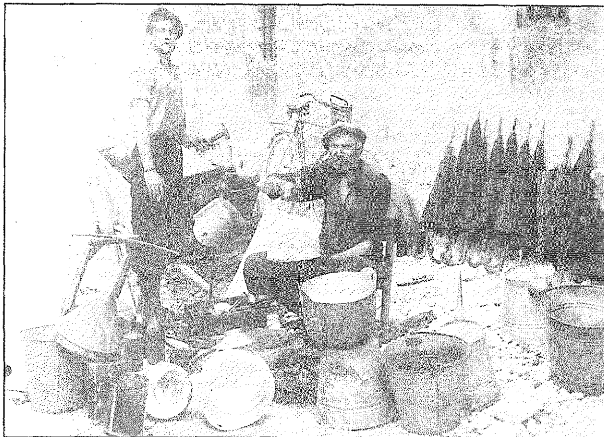
Rezijanski popotni obrtniki pri svojem delu takoj po 1. svetovni vojni. Travelling tradesmen from Resia during their daily work immediately after World War I.

podarski razvoj države. Operacija, kakršno je potem Italija izpeljala tudi z dvostranskim sporazumom s Francijo, je predvidevala tudi posebno korist, kar je ostalo dolgo časa javnosti prikrito in je nato vzbudilo veliko ogorčenja: za vsakega odposlanega delavca je namreč Italija dobivala v zameno določeno količino premoga, ki se je večala sorazmerno z večanjem izseljenskega kontingenta (Clavora, 1997, 93 sq.).