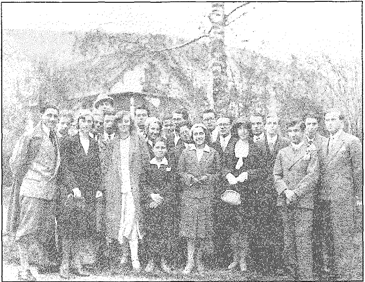
Primorski emigranti v Mariboru leta 1932 (NŠK). Emigrants from the Primorska region in Maribor in 1932.

razpolagamo s točnejšimi podatki, je ta tok v prvem štiriletju po vojni znašal šestino vsega izseljevanja od konca vojne do devetdesetih let (Kalc, 1991). Tržaško je nadalje dolgo časa doživljalo učinke druge svetovne vojne in blokovske delitve tudi v svojstvu prehodne postaje za politične begunce in "displaced persons" iz vzhodne Evrope, ki so tu čakali na odhod v razne kraje sveta.