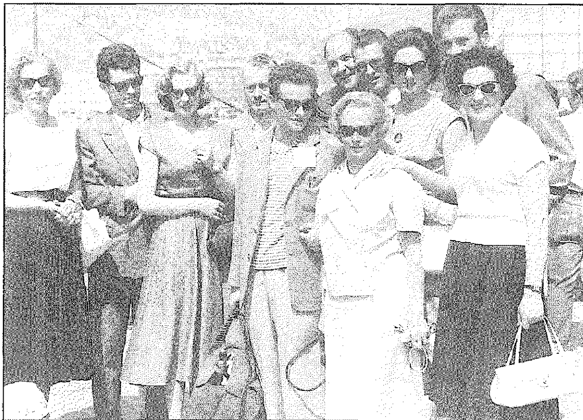
Tržaško prebivalstvo se je v 50. letih množično odločalo za odhod v Avstralijo (NŠK; foto: M. Magajna). In the 50's, there were a number of inhabitants of Trieste who decided to emigrate to Australia.

negativno obrestoval tudi v povojni zgodovini slovenske manjšinske skupnosti v Italiji. Po drugi strani se selitvena gibanja kažejo skozi prizmo družbeno-gospodarskih razmer, ki pa jih ravno tako ni mogoče ločevati od raznarodovalnega konteksta, bodisi ker so nastajale tudi zaradi načrtno diskriminacije, bodisi ker jih je fašizem izkoristil za uresničevanje t.i. etnične bonifikacije, s tem, da je s pozitivnimi posegi spodbujal odhajanje slovenskega in hrvaškega prebivalstva in ga nadomeščal z italijanskim. Pojav je tako zadobil množične razsežnosti, ki jih je sicer ob pomanjkanju ustreznih statističnih virov težko točneje kvantificirati. Verjetno pa se ocene, ki govorijo o 100.000 izseljencih in ki so jim nekateri italijanski zgodovinarji seveda oponirali z znatno nižjimi številkami, ne oddaljujejo od realnosti, čeprav je treba upoštevati, da je šlo pri ekonomskih emigrantih pogostokrat začasne odhode (Kalc, 1996, 28-30). Kvantifikacija kot tudi podrobnejša analiza strukturnih značilnosti tokov ter izseljenskih motivacij na mikroanalitični ravni, ki s prodiranjem v sfero subjektivnega doživljanja tistega časa lahko znatno pripomorejo k razumevanju izseljenske odločitve, ostajajo med poglavitnimi nalogami zgodovinopisja in ustreznih raziskovalnih ved. In to je tem bolj važno, če pomislimo, da bi v tistih okoliščinah lahko pričakovali