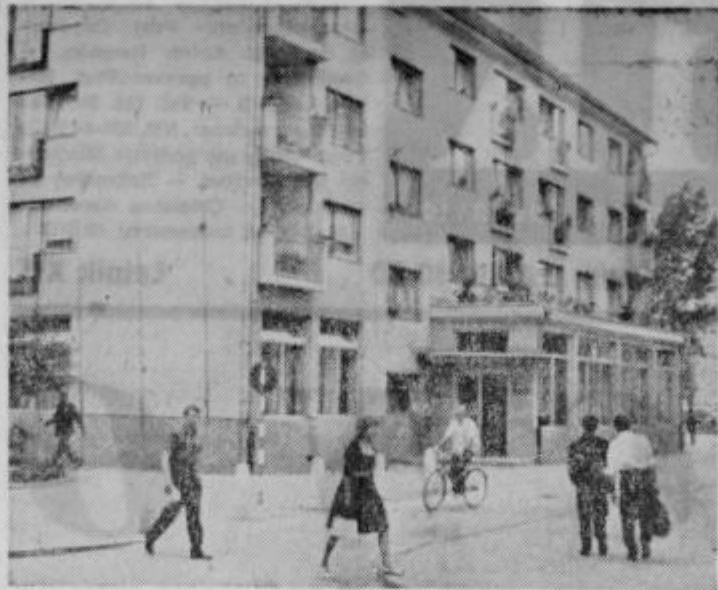
Poslojpe v Ptuj, v čigar desnem priličju so poslovni prostori Kreditne banke Ptuj, predstavlja za Ptuj pomembno poslovno stanovanjsko zgradbo.