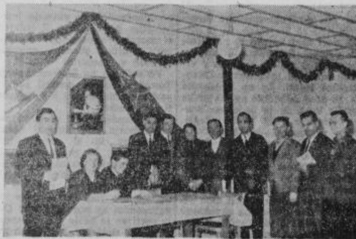
Ob svečanosti pohvaljeni za udarniško delo

Nova dvorana — jedilnica je dovolj prostorna, da posedajo ob prireditvah in praznikih na stole vsi člani kolektiva in da se razvije na odru lep program, ki si ga vedno pripravijo. Tako je minil za kolektiv čas, ko je imel vse prireditve izven podjetja, v rogozniškem kulturnem domu, kjer so bili vedno dobrodošli. Tudi sedaj podjetje rogozniških organizacij ne bo zanemarilo, pač pa bo nadalje obdržalo do-