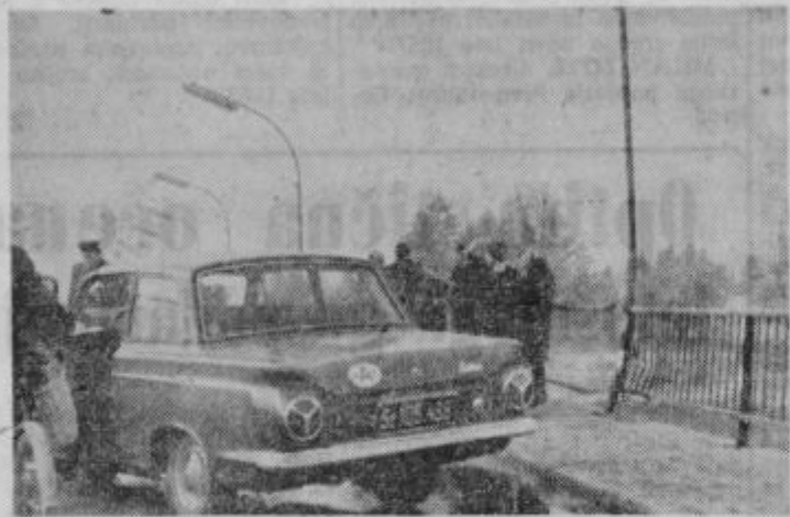
Avto St 105.438 po nesreči na mostu

Ta dogodek naj opozori šoferje na oprezno vožnjo v zimskem času. Ravno na mostu nastane