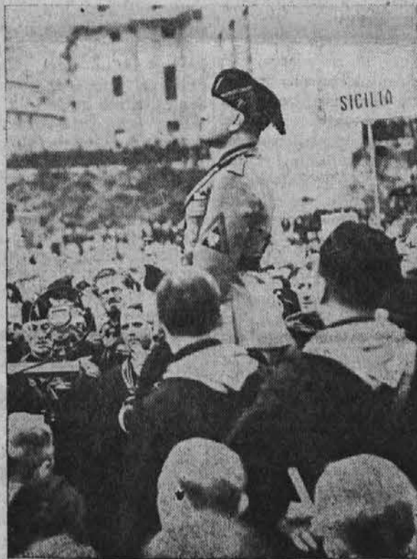
Musolini je govoril na zborovanju vojnih prostovoljcev v Rimu