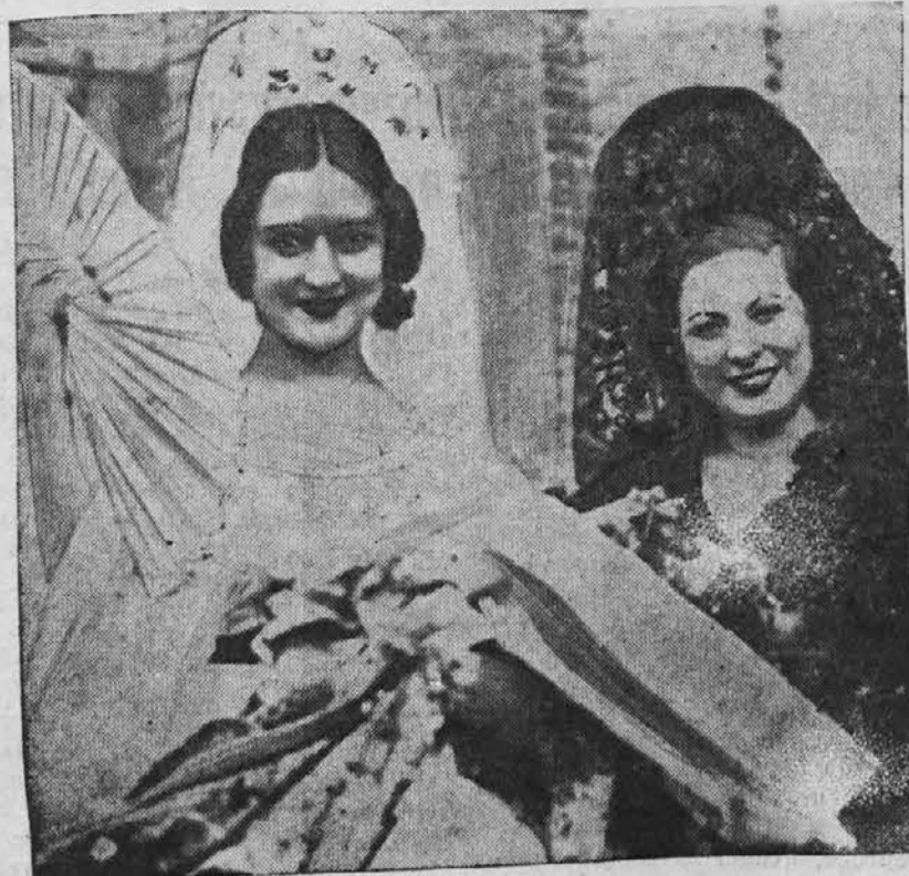
Španski lepotici: prvo so izbrali kot najlepšo v Madridu, drugo pa v Se- villi.