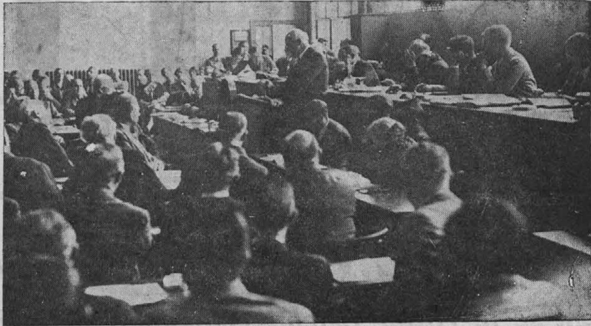
Neumrljiva ženevska konferenca: razorožitveni konferenci so že sto krat napovedali smrt, pa se diplomati še vedno shajajo v Ženevi. Slika nam kaže sejo, na kateri je govoril angleški zastopnik Sir John Simon

Najbolj važna zadeva za nas, delavce, je delo. Kako je torej z delavskimi prilikami tu, pri nas? Slovencev nas je tukaj precej in v splošnem lahko rečem, da imamo za sedanje čase še precej sreče; skoraj mi ni znano, da bi bil kateri izmed rojakov popol-