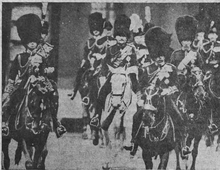
Častna garda angleškega kralja Jurija V.