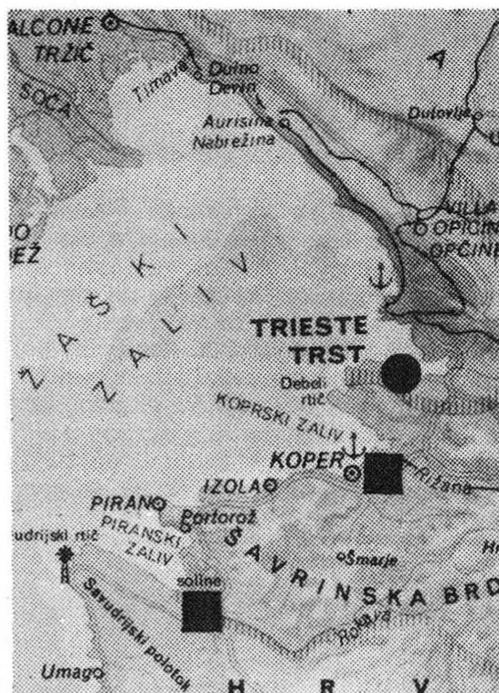
Slika 1: Gnezditvena lokaliteta in mesta opazovanja ovratniškega papagajčka na slovenski obali Figure 1: Breeding locality and the observation spots of the Ring-necked Parakeet on the Slovene coast