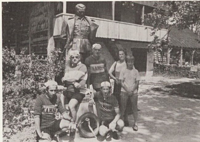
Slika za spomin

kolesarskih znancih. V žgoči vročini smo mimo vinogradov nadaljevali vožnjo skozi Štanjel, Dutovlje do Sežane, kjer so nas sprejeli prijazni in veseli prijatelji predsednika našega