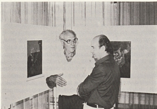
Umetnik pojasnjuje svojo novo tehniko slikanja