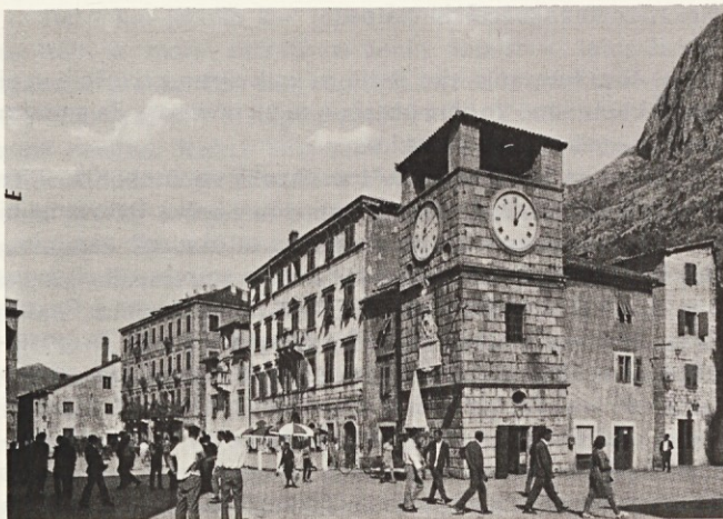
V središču Kotorja

Z družino sem preživel nekaj dni v SVILANIT prikolicci v Umagu. Žal nam jo je zagodla „višja sila“. Slabo vreme nam