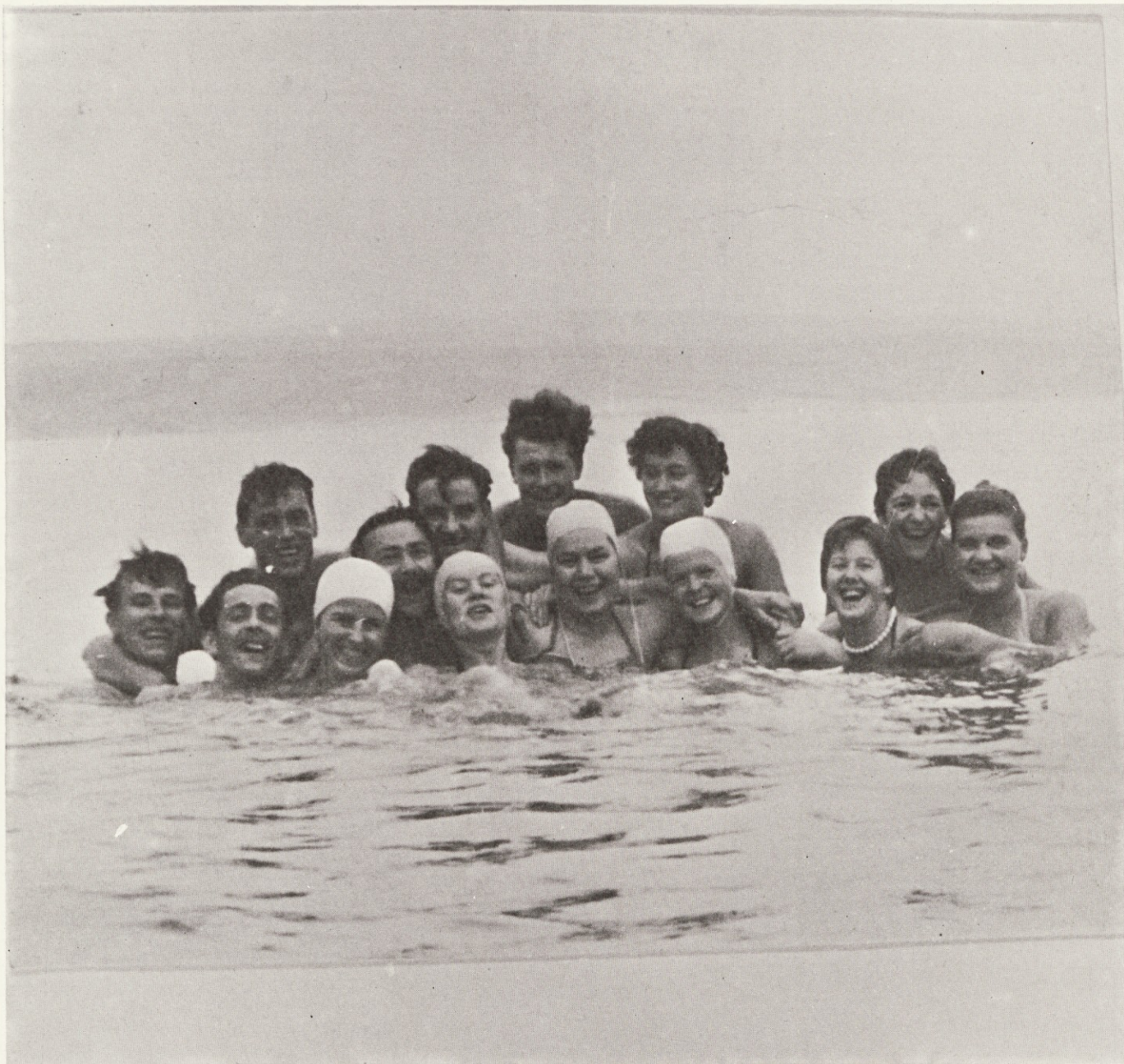
Sonce in veselje v vodi . . .

„KAMNIŠKI TEKSTILEC“ LETNIK XIX, ŠT. 7–8 1981 GLASILO DELOVNE ORGANIZACIJE „SVILANIT“ KAMNIK GLASILO UREJEUJE UREDNIŠKI ODBOR: Alenka Doplihar, Stankovič Brane, Okorn Tomaž Wiegele Bogo, Jerman Anton Tehnični urednik: SKAMEN IVANA Odgovorni urednik: BORIS ZAKRAJŠEK NAKLADA: 800 IZVODOV Tisk: Mestni muzej Idrija