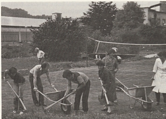
Aktivnost mladincev postaja vse večja

Po majhnem okrepčilu smo prijeli za krampe, lopate, grablje in delo je steklo v veselem ritmu. Tovarniški park se je spremenil v delovno mravljišče, kjer je imel vsak delavec svojo nalogo. Na enem koncu se je grabilo, na drugem kopal, vmes so švigale samokolnice, pri mreži pa je zidar s