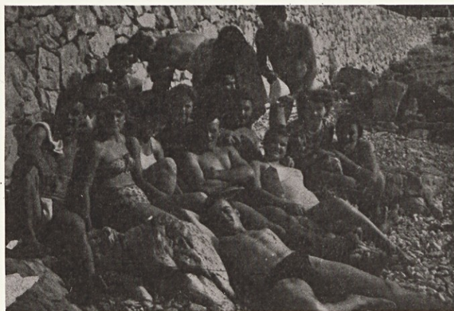
ter na kopnem

„KAMNIŠKI TEKSTILEC“ LETNIK XIX, ŠT. 7–8 1981 GLASILO DELOVNE ORGANIZACIJE „SVILANIT“ KAMNIK GLASILO UREJEUJE UREDNIŠKI ODBOR: Alenka Doplihar, Stankovič Brane, Okorn Tomaž Wiegele Bogo, Jerman Anton Tehnični urednik: SKAMEN IVANA Odgovorni urednik: BORIS ZAKRAJŠEK NAKLADA: 800 IZVODOV Tisk: Mestni muzej Idrija