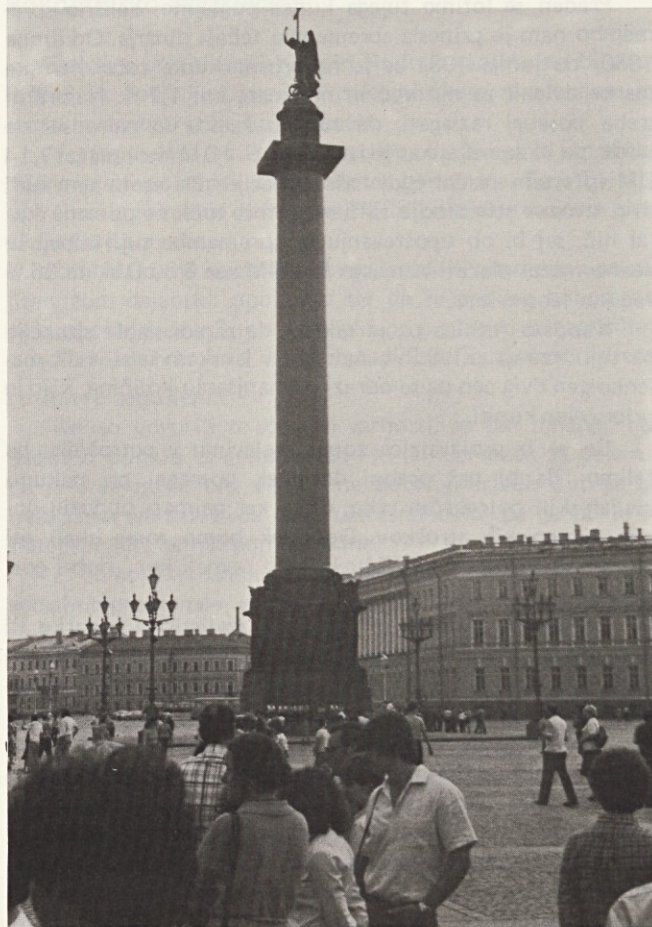
Spomenik na Dvorskem trgu

so med seboj povezani s 380 mostovi, zato ni čudno, da ga nekateri izmenjujejo — muzej mostov. Preko Neve se vzpenja 8 mostov, dolga je 74 kilometrov in je plovna. Leningrajski mostovi se dvigajo, enega smo tisti večer videli tudi mi.