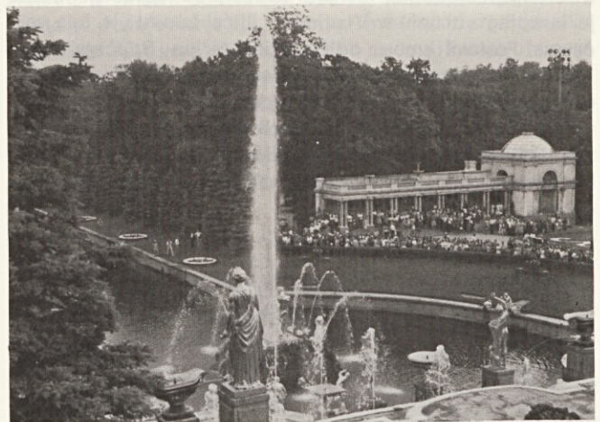
Nenavadno bivališče carja Petra Velikega

avtobusu, kjer je s svojimi kolegi kartal . . . Komentar je odveč, a veseli smo bili, ko smo se bližali hotelu Leningrad.