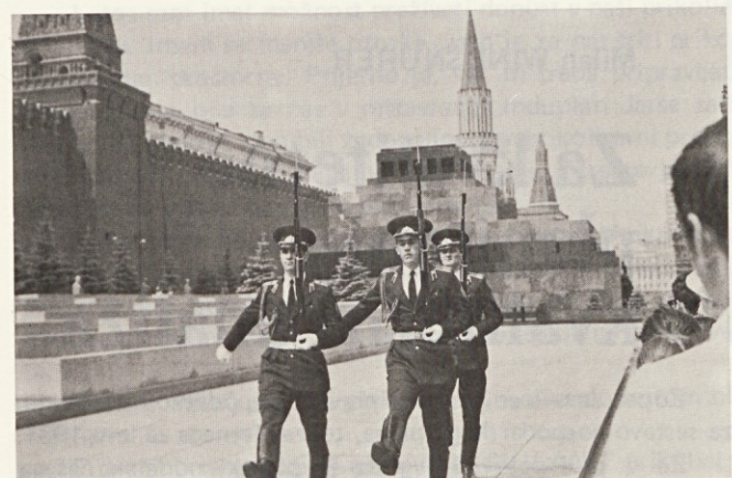
Pred Leninovim mavzolejem

S hladnim zajtrkom v vrečkah, smo se zgodaj zjutraj z avtobusom odpeljali proti letališču Pulkovo. Še enkrat smo s pogledi obnavljali znamenitosti Leningrada in se z lahkim srcem poslovili od pustih izložb trgovin, starih tramvajev in še bolj razmajanih taksijev. Z eno in pol urno zamudo zaradi okvare letala, smo zapustili Leningrad in po dobri uri letenja prispeli v Moskvo, „mesto usode“, ki sta ga zaman želela Napoleon in Hitler. Že na prvi pogled je Moskva povsem drugačna od Leningrada; je tipično evropsko velemesto. Nikoli pozabljeno ne bo prvo srečanje s Kremljem, ki je ponos Rusov. Trdnjava je zgrajena v 12. stoletju, ob koncu 15. stoletja pa so jo obdali s 16 metrov visokimi utrdami.