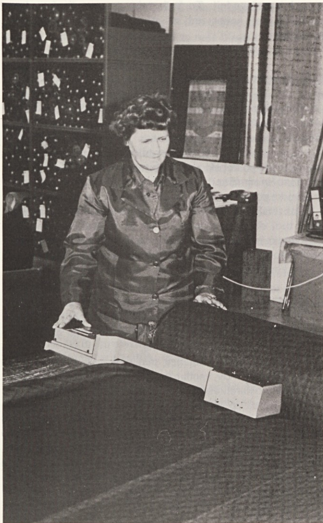
Zadovoljna je kadar ni mnogo napak

si za strojem. Na kontroli pa je že večja napetost zlasti zaradi ljudi, ko vrši kontrolo njihovega dela in če je morda preveč površno tkanje se kaj hitro pozna, da je potem kúverta „tanjša“ in zato je objektivnost tega dela še prav posebno izpostavljena. Kljub temu pa odnosi do sodelavcev in do nadrejenih in obratno niso nič skaljeni.