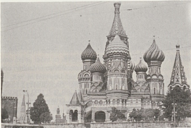
Ena od značilnih ruskih cerkva na Rdečem trgu

Čudovito lepe cerkve in 80 m visoka cerkev Ivana Velikega s pozlačeno kupolo, se nam zde kot pravljica sredi mestnega „živ-žava“. Videli smo Leninov mavzolej iz rdečega granita in črnega labradolita. Menjava straže pred mavzolejem, kjer je sarkofag s truplom Vladimirja iljiča Lenina, je bila veličastna. Poslovili smo se od čudovitih cerkva, Rdečega trga — Kremlja in znane kremeljske ure na stolpu Spaskega, katere glas prenaša radijska postaja v Moskvi. Po zelo dobrem kosilu v hotelu Inturist, smo pripravili še zadnje devize za nakup zelo ljubkih spominkov v hotelski berioski. Tu smo našli vse, kar smo zaman iskali v Leningradu, žal pa nam je zmanjkalo denarja.