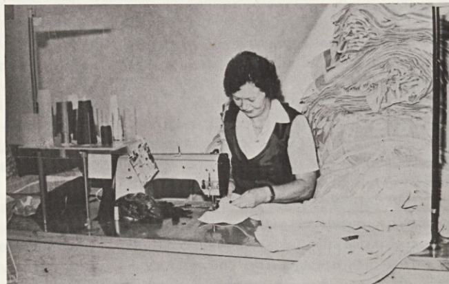
Mari se zaveda, da je pazljivost pri robljenju brisač nujna

V pogovoru se je dotaknila discipline, o kateri je bilo veliko govora, vendar meni, da bi bila lahko tudi boljša. Tudi