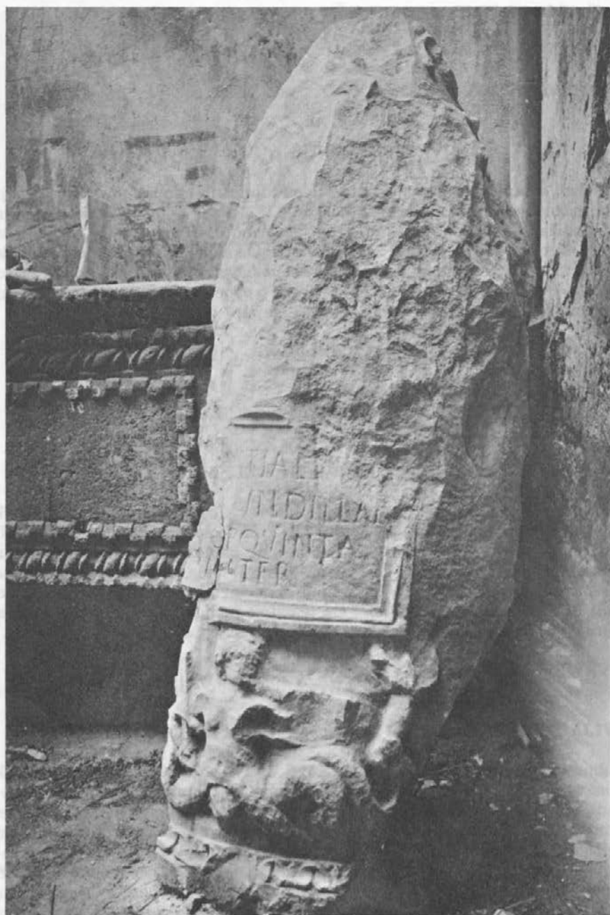
Sl. 2: Liburnski nadgrobní spomenik iz Asserije pohranjen u Arheološkom muzeju u Zadru (kat. br. 6).