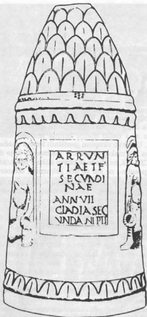
Sl. 1: Liburnski nadgrobní spomenik iz Asserije koji se čuva u Veroni (kar. br. 1).

Abb. 1: Liburnisches, in Verona verwahrtes Grabmal aus Asseria (Kat. Nr. 1).