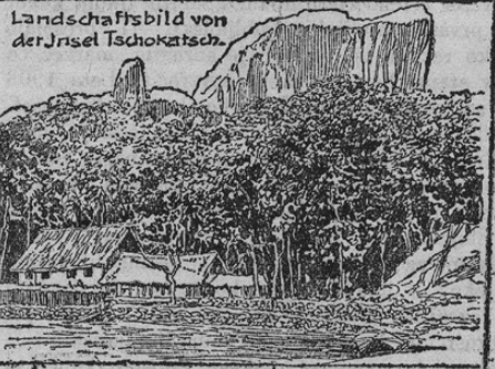
Landschaftsbild von der Insel Tschokatsch.