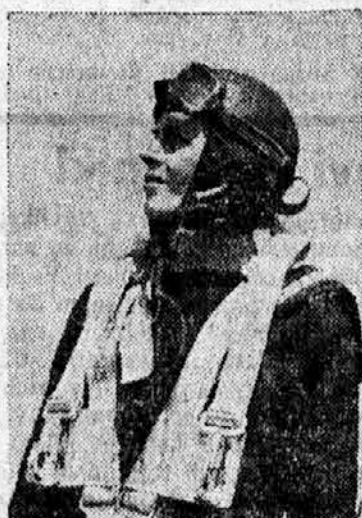
vojnega mornariškega letalstva