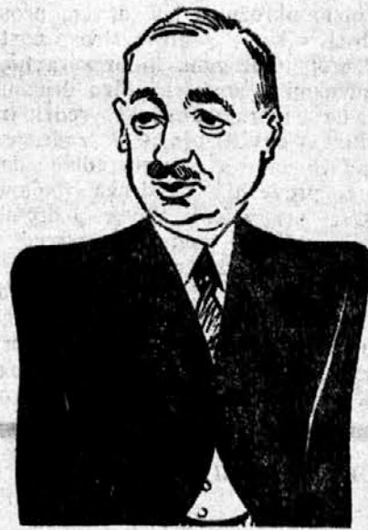
Prof. FILOV predsednik bolgarske vlade

30.000 francoskih vojakov interniranih v Švici, se bo lahko vrnilo domov, tako v zasedeno, kakor nezasedeno Francijo. Nemška vlada je že pristala na to, pišejo švicarski listi.