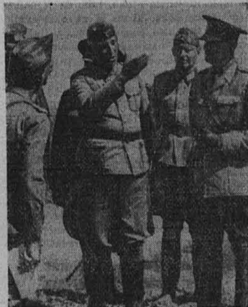
Generalfeldmarschall pl. Manstein

Berlin, 20. julija. Neka v žarišču bojev pri Golov-Orlu in Bjelgorodu uporabljena divizija protiletalskega topništva javlja, da je v času od 5. do 14. julija sestrelila 173 boljševiskih letal, večinoma močno oklopljenih bombnikov. Od teh je samo en polk protiletalskega topništva tekom 48 ur sestrelil 102 letal. Nadalje so odredi divizije uničili 20 oklopnjakov, 35 topov in protioklopnjaških topov, 79 bunkerjev in vojnih utrd, 125 postojank strojníc in metalcev granat. Sovražnik je zgubil, ker je posegla vmes ta divizija protiletalskega topništva, številne mrtve in ranjene.