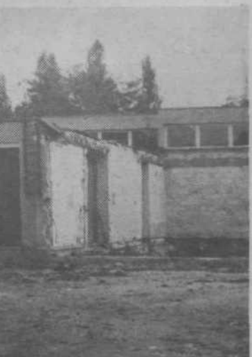
SANIRANJE VVZ ANGELCE OCEPEK - Najbolj poškodovani del stavbe je porušen - to je prva faza sanacijskih del na poškodovanem poslopiju vrtca Angelce Ocepek. V drugi fazi bodo popravili poškodovani obstoječi del stavbe z okrepitvijo temeljev, sten, centralnih sanitarij, inštalacij itd. Ta dela bodo končana do konca leta. Za tretjo fazo je v načrtu gradnja novega dela stavbe, ki je sedaj porušena. Pričetek del bo mogoč, ko bodo zagotovljena sredstva. Od 800 starih milijonov, kolikor bo stala celotna sanacija, manjka še 150 starih milijonov.

Objekti v pripravi - V programu 1975 - 1976 je gradnja še 9 vzgojnovarstvenih zavodov. Priprave o vseh projektih tečejo. V naši občini gre za dva projekta, in sicer za VVZ Selo in VVZ Polje. Za VVZ Selo -