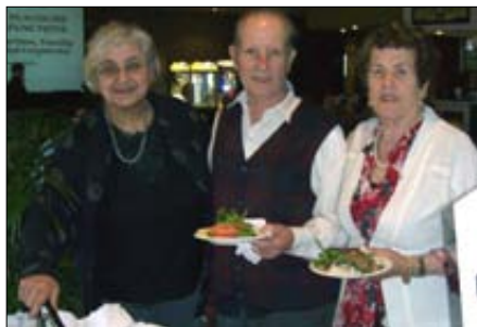
Kosilo za očetovski dan.

Ob spremljavi kitare in klavirja smo kmalu vsi skupaj prepevali in kar žal nam je bilo, ko smo se morali odpraviti domov.