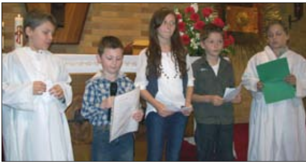
Učenci Slomškove šole v Merrylandsu.

modernejši način poučevanja slovenščine, saj so današnji otroci bolj navajeni na računalnike. Imamo srečo, da imamo učiteljice, ki imajo voljo in sposobnost modernizirati našo šolo, problem pa je, da Slomškova šola nima računalnikov, ki bi jih otroci lahko uporabljali za učenje. V današnjih časih večina ljudi, ki uporabljajo računalnike, pogosto nabavijo nov računalnik vsakih nekaj let in mogoče bi se našel kdo, ki bi bil pripravljen darovati svoj stari računalnik šoli, da bi se učenci lahko učili. Poleg nižjih razredov Slomškove šole