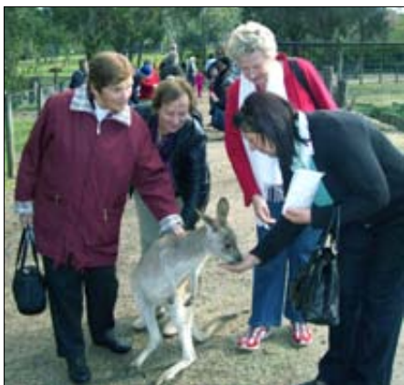
Hranili smo kenguruje.

časom v stari domovini. Julijski izlet nas je popeljal najprej na obisk Symbio živalskega vrta v Helensburghu, blizu Wollongonga, kjer so na sorazmerno majhnem koščku divjine začeli z gojenjem divjih živali iz Avstralije, Tasmanije in še nekatere druge ogrožene vrste, da bi jim pomagali v borbi proti izumiranju. Symbio zatočišče je blizu Sydneya in zelo lepo urejeno, tako, da je še posebno privlačno za družine z otroki, kar je bilo tudi jasno videti posebno v juliju, ko je bil čas šolskih počitnic.