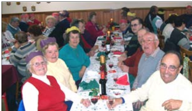
V prazničnem razpoloženju.

Ob spremljavi kitare in klavirja smo kmalu vsi skupaj prepevali in kar žal nam je bilo, ko smo se morali odpraviti domov.