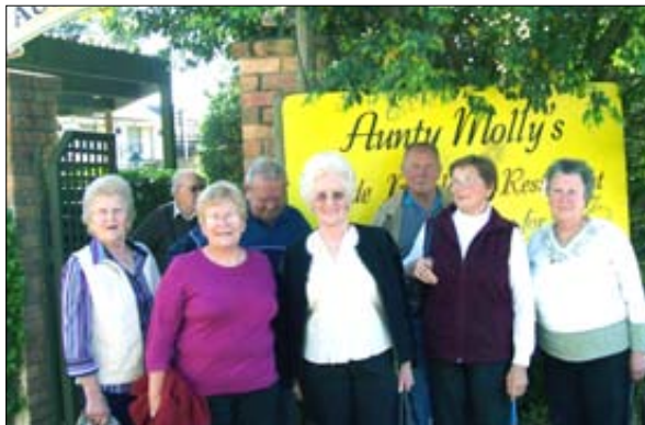
Pred restavracijo Aunty Molly's.