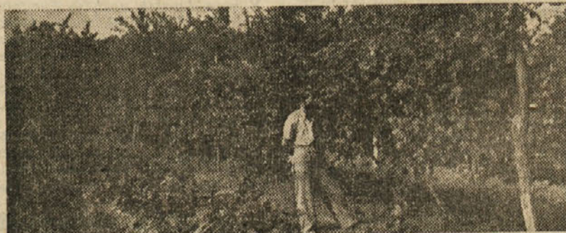
Borec za hektarski donos z zadovoljstvom ogleduje letošnji pridelek

Povsod, kamor pogledaš, v Brdih ali Vipavski dolini, se pod svetlozelenimi listi črniijo in rumenijo jagode letošnjega grozdja. Kljub temu, da je dobro rast trte onemogočal dež in kljub temu, da je v Vipavski dolini precej grozdja pobila toča, bo letošnji pridelek še kar zadovoljiv.