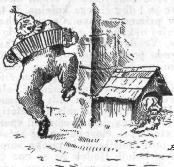
Nande norce brije, skače,

Zmaj je spredaj, zadaj pa je črni voz velika vrsta, sedeš vanje pa se pelješ lahko prav do Trsta.