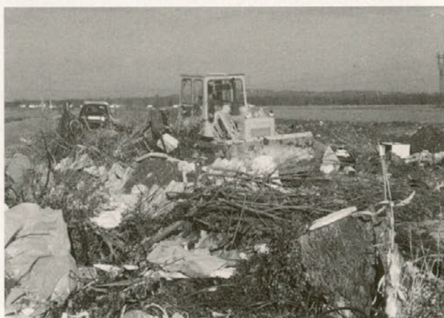
Zaskrbljujoč pogled na nedavno sanirano Frasovo jama v Cirkovcah.

kakšno drugo pot. Vendarle so posledice tega dobro vidne na številnih divjih odlagališčih, saj se nekateri