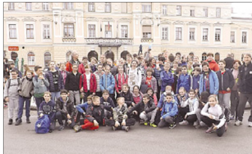
Udeleženci včerajšnjega teka z nižje srednje šole Ivan Trinko

Na programu je bilo osem tekov, pri katerih se je izkazalo, da so med učenci velike razlike v atletskih sposobnostih: prvi na cilju v vsaki kategoriji so manj pripravljene pustili daleč za seboj. Zelo dobro se je odrezala doberdobska šola, ki je odnesla dve prvi, dve drugi in eno tretje mesto. Po koncu tekmovanja dela so na trgu objavili rezultate in razglasili zmagovalce. Kolajne so šle