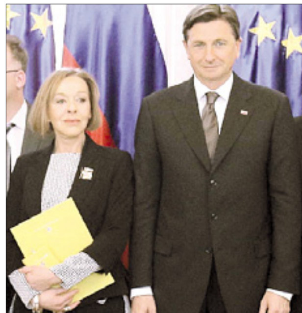
Milena Zupančič ob predsedniku Pahorju