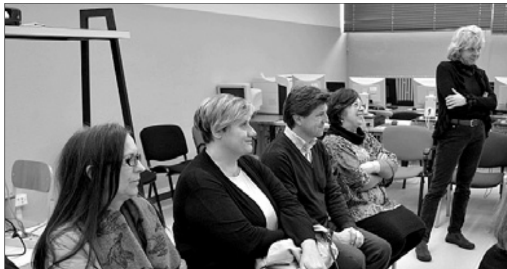
Levo del udeležencev predstavitev novega priročnika; desno izvodi priročnika v slovenskem prevodu

Projekt vzgoje k prometni varnosti »SicuraMente Insieme - Varno skupaj«