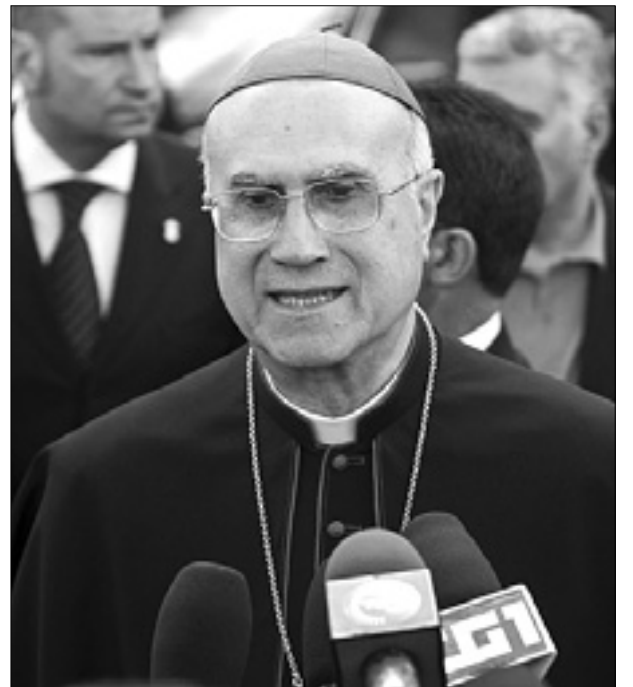
Kardinal Tarcisio Bertone je vpleten v stanovanjski škandal