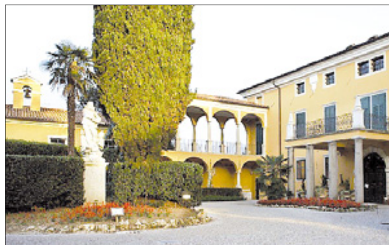
Dvorec Coroninijev v Gorici