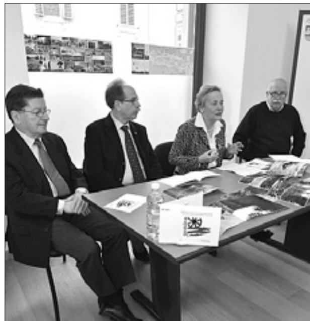
Zaključek projekta Gemina so predstavili na sedežu Pokrajine Trst; del pešpoti med trtami in spominskimi obeležji

Celotno pešpot bodo namenu svečano predali prihodnjo soboto