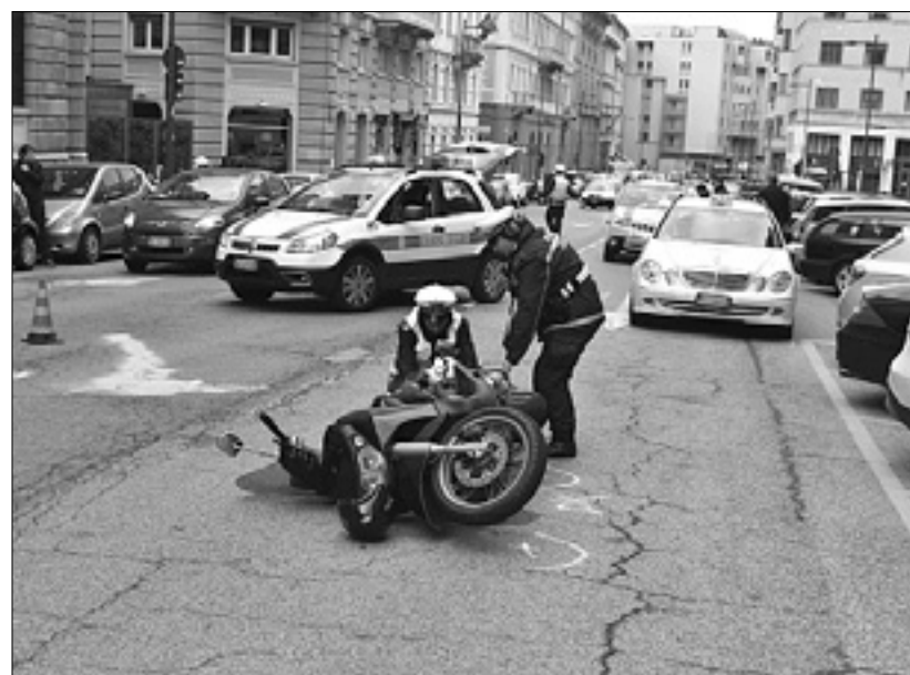
Taksi so medtem zasegli

Preiskavo o poteku dogodkov vodijo mestni redarji; medtem so taksi zasegli.