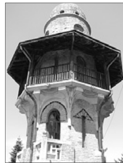
Stolp Vile Rafut

RAFUT - Ministrstvo Za vilo ni zanimanja, rok znova podaljšan