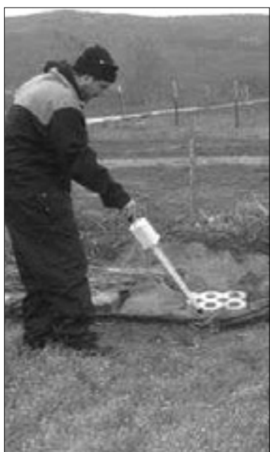
Intervencija pri Vrtojbi