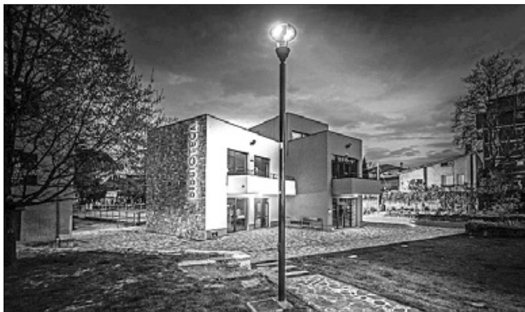
Prikaz prenovljene knjižnice v Miljah