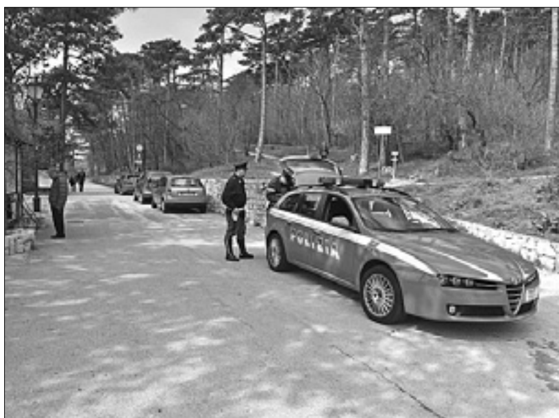
Preiskovalci na Napoleonski cesti

V sredo zvečer pa je prišlo do srhljivega odkritja na Vejni. Preiskovalci sinoči niso vedeli povedati, ali gre za pogrešanko, ki je bila izginila še pred božičem. Za istovetnost bo zato treba počakati na analizo DNK-ja.