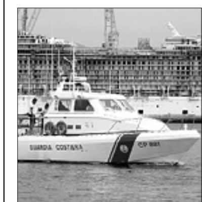
Izvidnica luške kapitanije

Kriminalistična preiskava še vedno poteka v okviru predkazenskega postopka in ni še zaključena, obveščena sta bila tudi preiskovalni sodnik in pristojno okrožno državno tožilstvo v Novi Gorici. Več podrobnosti o poškodovani osebi in napadalki pa policija ne razkriva. (km)