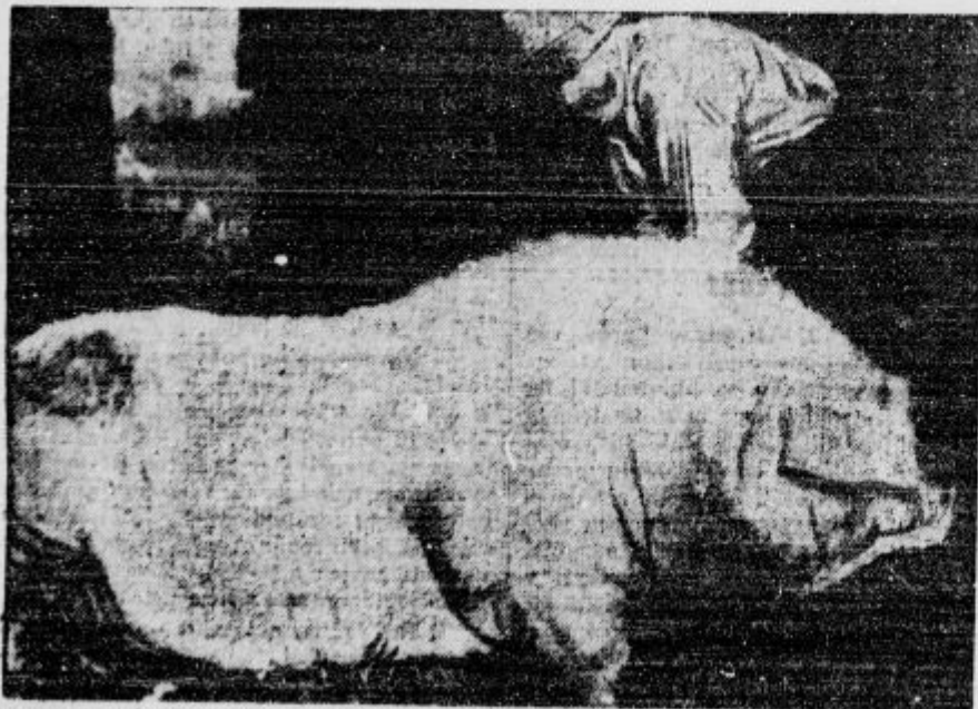
Orijanskega prašča je vzredil ameriški farmar v Newburu. Ta prašič menda nima para na svetu. Tešak je 1600 angleških funtov, kar je po naše nekako 725 kg. Pital pa ga je tako, da mu je vsak dan dajal po več litrov mleka in po 20 do 30 jajc.

d Jug. nac. stranka in njeni voditelji se vedno bolj zavedajo, da so bitko, ki so jo vodili zadnje tedne proti Stojadinovičevi vladi, izgubili. Fašistični in komunistični agitatorji se vračajo z dežele v Belgrad poparjeni, ker niso imeli uspehov v razširjanjem laži in letakov s hujskajočo vsebino. Sami priznavajo, da se je igra opoziciji ponesrečila. Navidezno dobrohotni predlog opozicije Narodni skupščini, naj se konkordat odloži in postavi na dnevni red za poznejši čas, ni imel samo namena, da bi opozicija pozneje mogla trditi, kako je Stojadinovičeva vlada slaba in je konkordat umaknila, temveč je imela opozicija namen, da pomakne ratifikacijo konkordata čim bližje volitvam, tako, da bi lahko šla na volitve pod geslom konkordata kajti JNS in drug dobro ve, da je v slovenskih in hrvatskih krajih pristaše izgubila in ve tudi, da s temi lažmi in hujskanjem ni pridobila nobenega člana, pač pa je zgubila še one, kar jih je imela; kajti že kdaj, se je v zadnjih mesecih pokazalo, da je JNS zgrajena na la-