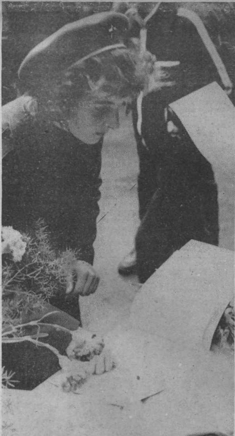
V vojašnici Josip Broz Tito na Poljanekih cestah je te dni zaprisegla nova generacija mladih vojakov. To pot so zaprisegle tudi ženske pripadnice JLA.

Pobudo za spremembo je dal občinski odbor ZZB NOV in predlagal, naj bi za praznik občine določili 21. junij. Tega dne so namreč ljubljanske žene množično demonstrirale proti okupatorjevemu nasilju. Demonstracije so bile leta 1943 in sicer 7., 15. in 28. februarja, 12. maja, 21. junija in 1. avgusta. To je bilo edinstveno dogajanje v okupirani Evropi. Glede na to, da so demonstracije potekale prav na območju občine Center, je vsekakor umestno, da zaslužijo obeležbo, kakršna je predvidena v osnutku odloka.