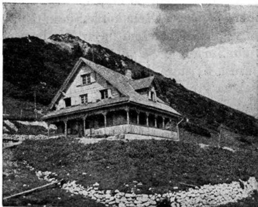
Roblekov dom

Naslednje jutro sem se prebudil prej ko mati. Lastovka je začela cvrčati. Tiho sem se oblekel in stopil k postelji matere, ki je imela roke mirno sklenjene in je mladi dan sijal na njeno lice. Pogled nanjo me je prešinil z ljubeznijo in žalostjo, saj sem bil videl zadnjič hišnikovo Barbaro, ki je tako tiho, sklenjenih rok ležala v krsti. Tako zelo sem se prestrašil, da sem z divjimi poljubi zbu-