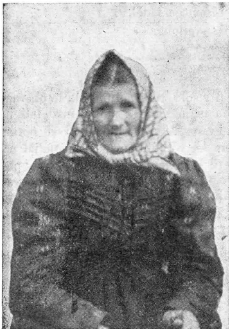
Pisateljova ✕ mati.

vseh svojih obilih poletnih poslih — ob treh zjutraj ste vstajali, ob enajstih zvečer legli k počitku — ste našli časa za vse moje potrebe in nadloge in še tople tolažilne besede. Spominjam se tudi, kako široko razumevanje ste imeli za moje počitniško delo v vseučiliških letih. V Vipavi smo prirejali v tistih letih razvijajočega se društvenega delovanja katoliški študentje kako narodno igro, na Colu in Vrhpolju sem pa včasih učil in režiral. Vse skušnje so se vršile pozno v noč. Čakali ste me, čeprav sem prišel ob enajsti ali dvanajsti uri domov, da ste mi odprli vežna vrata; nikoli niste radi tega godrnjali ali se nad menoj jezili.«