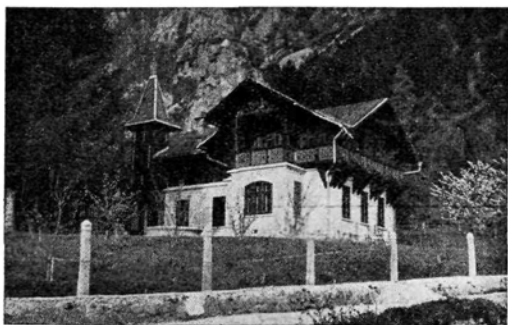
Vila za letovanje v Begunjah. (Tujsko prometno društvo.)

zato pravico, da si zagotovi v primeru potrebe življenjske potrebščine z meznim delom. Kot vsaka osebna pravica pa mora biti tudi ta v skladu z zahtevami splošne blaginje. Pravica žene do dela pa ne more biti omejena samovoljno v tistem obsegu, ki ga dopušča splošna blaginja.