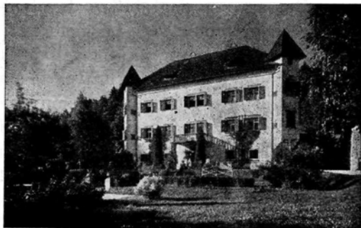
Dermiski grad pri Begunjah. (Tujsko prometno društvo.)

»Zato, ker je bil gospod. Ker je bil lepo oblečen, obrit, parfumiran in ker je imel v žepu denar, ali pa se je vsaj delal, da ga ima. In o poštenju bogatih ljudi nihče ne dvomi, dokler ne počenjajo v zavesti svoje varnosti še takšnih svinjarij, da se vse mesto hočeš nočeš prime za nos... Ti in jaz pa sva vedno sumljiva, zato ker hodiva okoli v obnošeni obleki in kadiva najslabše cigarete. Če greva po ulici, bo imel policaj vedno oko za nama. Tako je pri nas in vsepovsod po svetu. Če bi bil ti policaj, bi delal ravno tako. Pozdravljal bi lepo oblečene gospode in škilil za tistimi, ki imajo prišito zaplato na zadnji plati svojih hlač. Tudi jaz bi morda delal tako, če bi bil šel za policajja. Tako sva bila že pač vzgojena v tej miselnosti. In najini revni starši so bili tisti, ki so nama vcepili to miselnost v glavo. In ne samo nama, vsi reveži na svetu gledajo v bogatih same poštenjake, zato se jim tudi dajo izrabljati. In teh misli jim ne ti ne jaz ne bova pregnala iz neumnih glav, razen če boš šel k vsakomur, mu vzel možgane iz glave, jih pošteno izprašil in prezračil ter mu jih spet zmašil v lobanjo. Mogoče bi potem boljše delovali. Vidiš, tega pa ne moreva storiti in zato bo tako ostalo, kakor je. Ti boš ostal vse življenje sumljiv človek, če ne boš začel na debelo goljufati, tako da boš obogatel. Šele potem boš