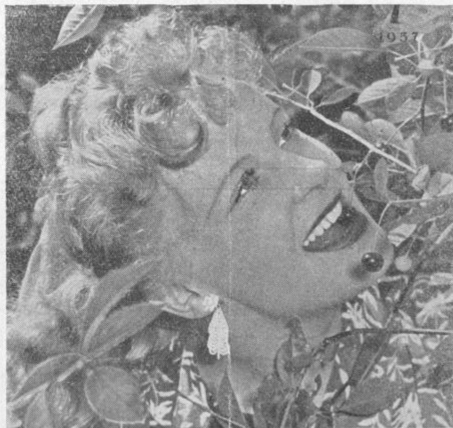
Dva sladka sadeža, mar ne? Češnje — te so verjetno bolj kisle in Alla Tariova, najbolj popularna ruska igralka na festivalu v Benetkah 1953