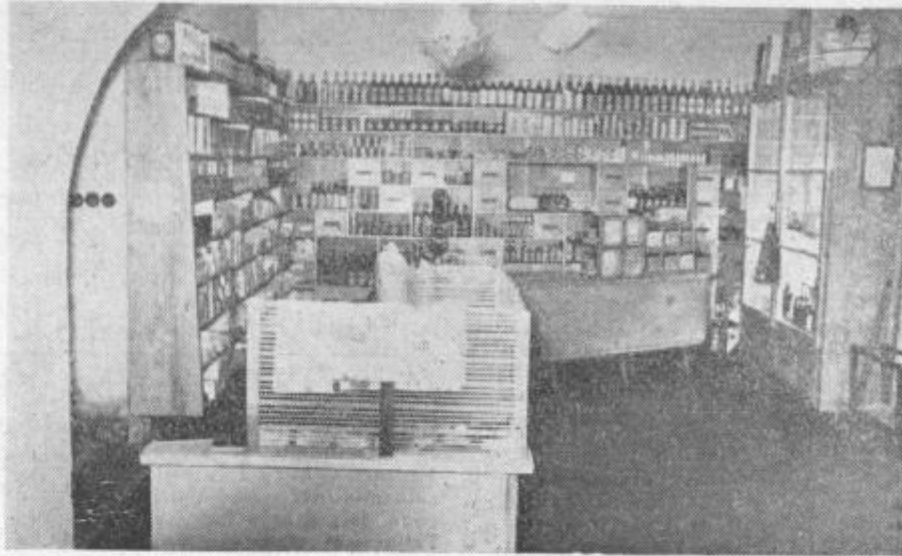
Trgovina v Laškem — Specerijski oddelek

trajalo od 1. avgusta do 30. novembra lani. Trgovine so tekmoval v postržbi, snagi, estetskem izgledu prodajaln, izbiri in razporeditvi blaga ter v urejevanju izložb. Čeprav so se v tekmovalje