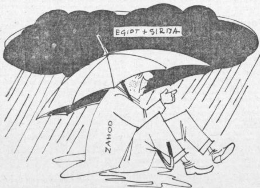
Slabo vreme s krajevnimi padavinami.

Moziirja, Kozjega in Celja po 15 mladincev, iz Sentjurja Rogaške Slatine, Smarja, Konjice, Zalca in Laškega po 10, iz Vojnika 8 in Vrnskega 4.