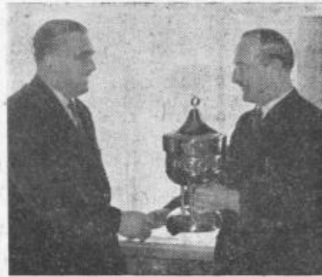
Poslovodja trgovine v Laškem tovariš Colnar sprejema pokal

vdjučile vse trgovine, so občinske komisije ocenile tekmovalje samo v 7 občinah, tako da je 5 občin v zaključnem tekmovalju odpadlo. Prvo mesto v laški občini in okraju je dosegla poslovalnica št. 3 Trovskega podjetja IZBIRA v Laškem, ki je poleg diplome prejela tudi pokal. Ostale trgovine so prejele diplome. Trgovine tega podjetja so vzorno urejene in so potrošniki z njimi kar najbolj zadovoljni. V ostalih občinah so bile najboljše: poslovalnica št. 3 Savinjskega magazina Zalec, poslovalnica Ljudskega magazina Celje v Velenju, poslovalnica Trgovskega podjetja Potrošnik Vojnik v Strmcu, Specerija — poslovalnica Trgovskega doma v Slovenskih Konjicah, poslovalnica Kmetij-