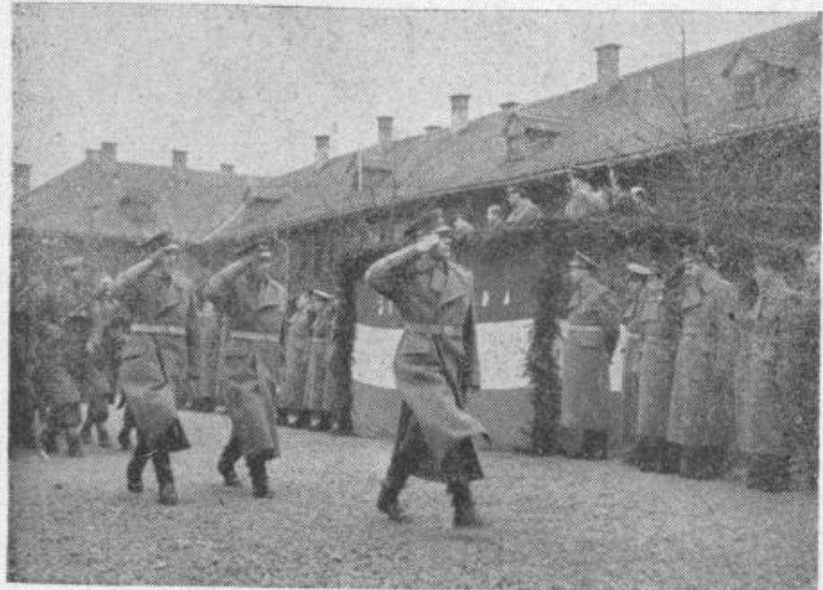
Na zaključku proslave je bila parada...