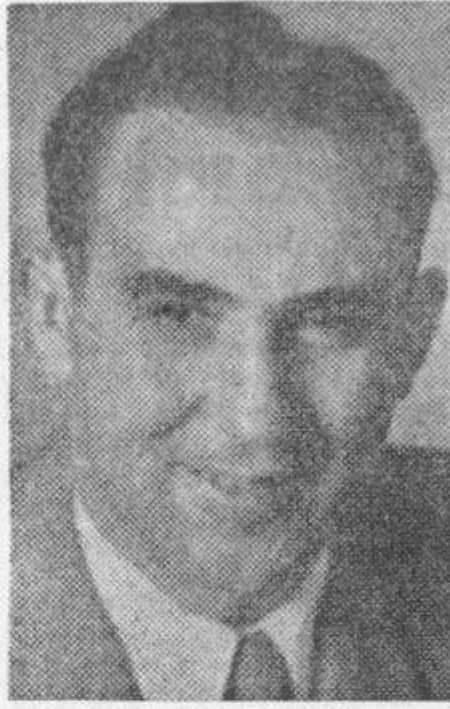
Tov. Stane Kavčič

Na občnem zboru Okrajnega sindikalnega sveta v Celju je predsednik republiškega sveta Zveze sindikatov Slovenije tovariš Stane Kavčič podal nekaj splošnih pripomb na delo sindikalnih forumov. Ena od teh osnovnih slabosti je, da je delo sindikalnih forumov preveč propagandistično ter se zaradi tega izrodi v parolastvo, s katerim se sicer vsi strinjamo, ko pa pridejo direktive do sindikalnega članstva, ni čutili pravega odmeva. Borba za socialistične odnose se mora namreč odražati pri konkretnem delu in v stalnih