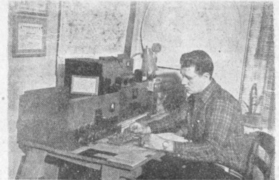
Za takole mizo ima amater zvezo z celi m svetom...

jo prosila, naj ostane pri njih. Na glas je zajokala tudi rejnica sama — medtem ko se je Gretica kar hitro znašla in objela njova roditelja.