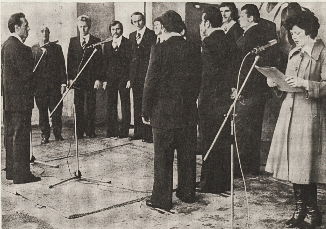
Nastop ob otvoritvi novega silosa