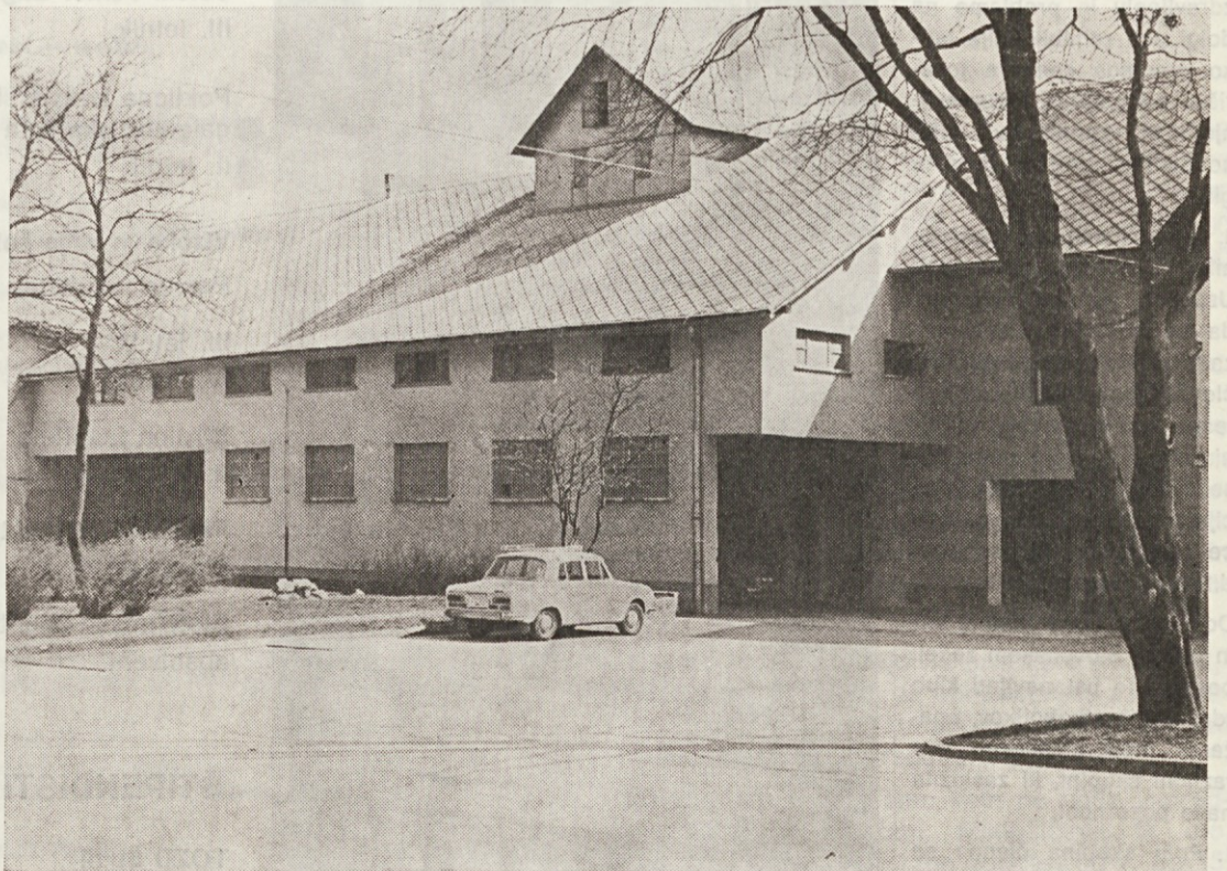
Na domžalskem področju je že dolgo vse po starem

Odgovorne naloge, ki so jih obravnavali in si jih zadali delavci na sindikalni konferenci v DE Domžalsko področje, bodo uresničevali lahko le tako, če bodo hotenja posameznika izražena v njegovem lastnem aktivnem delu za našo samoupravno družbo, za svojo in našo boljšo bodočnost.