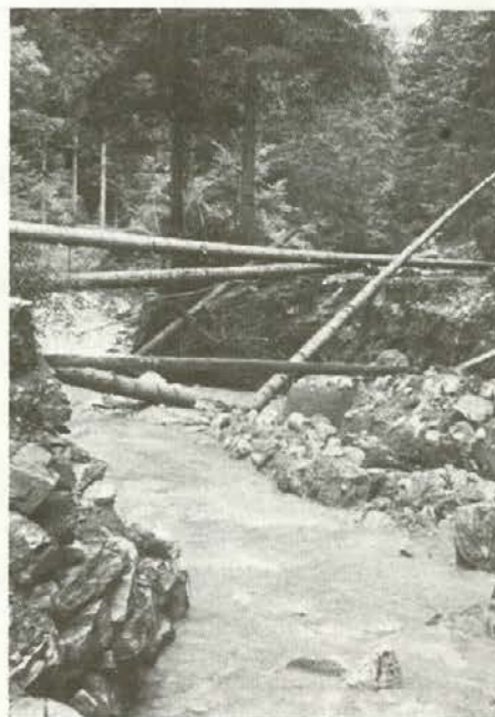
Tako se je v pol ure spremenila cesta Suhi dol—Plešivec med odd. 26 in 11 v Kaštelskem jarku — edina povezava s Slovenj Gradcem