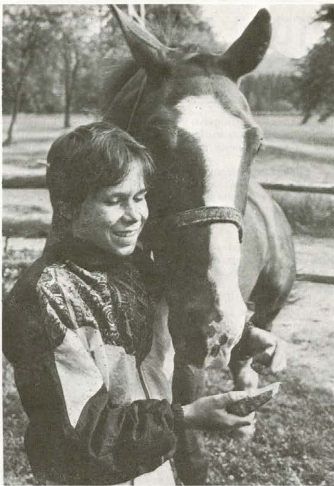
»Midva sva dobra prijatelja« ...