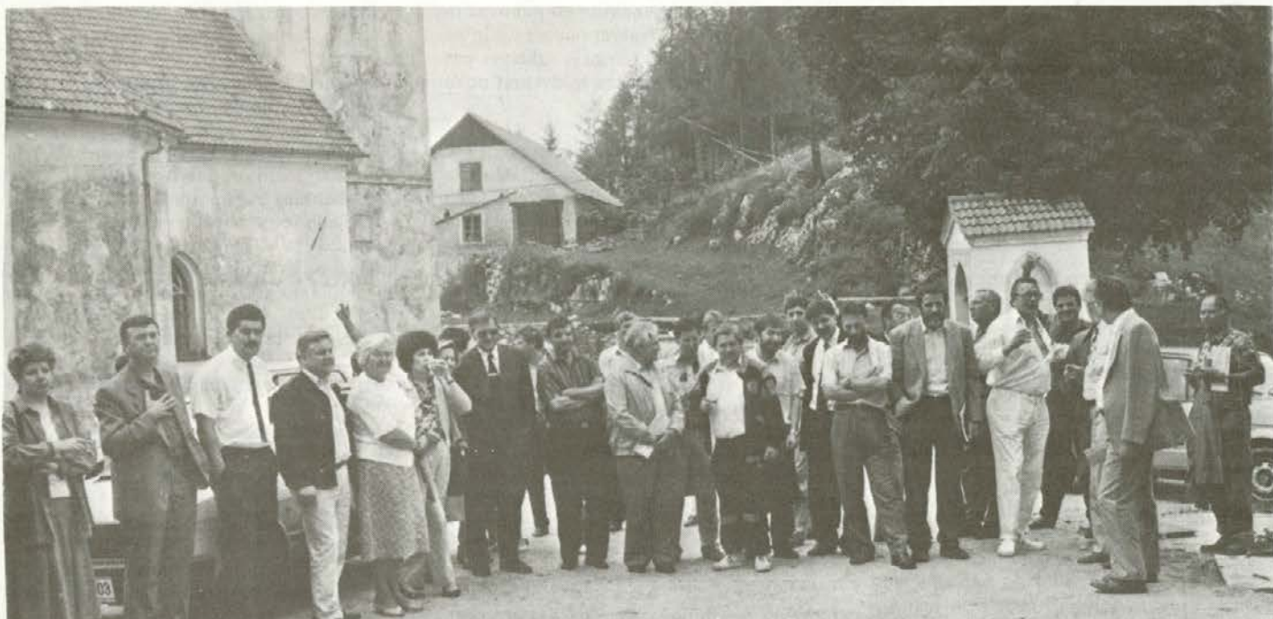
Na 25. redni seji vseh zborov skupščine občine Slovenj Gradec so se delegati zbrali na Paškem Kozjaku, od koder je tudi posnetek