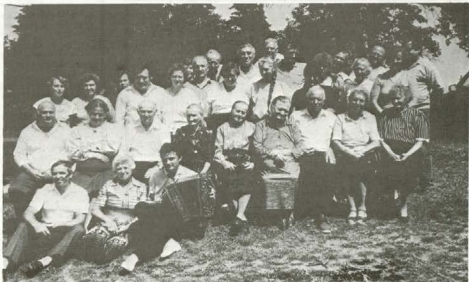
Na Završah nad Mislinjo so se tudi letos srečali starostniki in krvodajalci