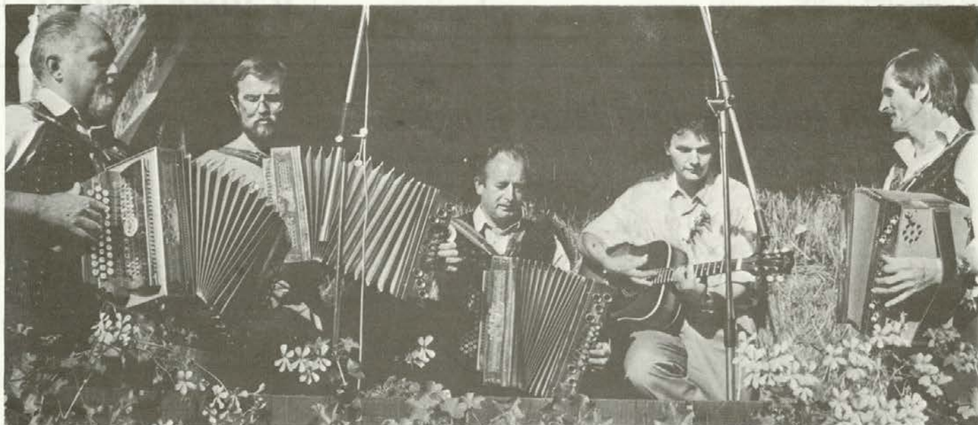
Nad vse zanimivo je bilo letos pri Najevski lipi števnanje. Števanci so pokazali svojo spretnost.

Tudi letos je pri lipi na harmoniko zaigral Lojze Peterle, na kitaro ga je spremljal Marjan Podobnik v družbi harmonikarjev KUD Gozdar Črnae. In kdo bo prihodnje leto igral z Lojzetom...?