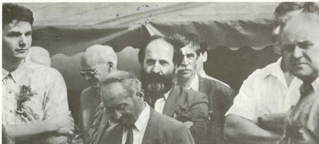
Ugledni gostje na srečanju pri Najevski lipi