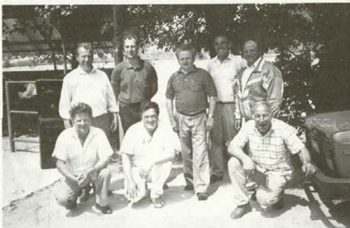
Naši dve skupini iz aktiva Stari trg in Pameče, ki sta nas zastopali na avtoreliju dne 17. 5. 1992