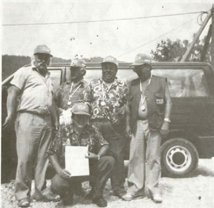
Naša uspešna ribiška družina v Ilirski Bistrici 4. julija