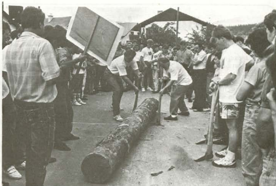
»Pajsanje« hlova na asfaltu ni tako enostavno