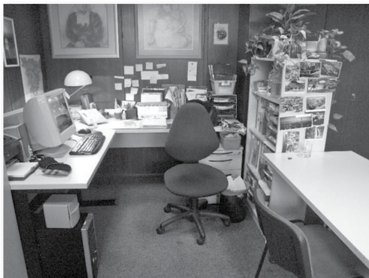
Moja pisarna, ki sem jo delila še s štirimi kolegi in kolegicami