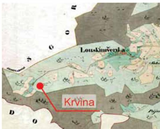
Krvina v Lovskem Brdu, št. 4. Sedaj Lovsko Brdo, št. 4 in priimek Jelovčan. (ARS, AS 176, L199/4 in L199/7)