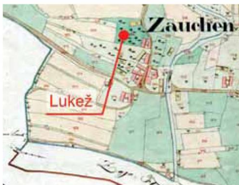
Lukež na Suhi, št. 27. Hiše ni več, sedaj je tu večstanovanjska stavba na Suški cesti, št. 54.