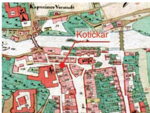
Kotičkar v Škofji Loki, Mesto, št. 109. Danes Thalerjeva hiša na Mestnem trgu, št. 42.