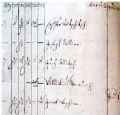
Priročni urbar gospodstva Škofja Loka (1709–1714).