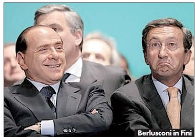
Berlusconi in Fini

vajeni sodelovati pri razpravah in odločitvah stranke, se niso mogli sprijazniti s takšnim pomanjkanjem notranje dialektike. Na to razpoloženje je večkrat opozoril Fini, ki je Berlusconiju očital vodenje stranke v “kasarniškem duhu” in zahteval demokratično diskusijo in sklepanje v stranki. To pa so Berlusconi in njegovi najozži sodelavci stalno odklanjali, češ da tako množična stranka, kot je Ljudstvo svobode, si ne more privoščiti tveganja, da bi notranje razprave v širšem krogu ovirale delovanje vlade, kot se je dogajalo v prejšnjih desetletjih. Predsednik zbornice in soustanovitelj Ljudstva svobode je tako prišel do spoznanja, da Berlusconijeva avtoritarna vodenja stranke in državne politike ne bo mogoče odpraviti s prepričevanjem, temveč je potrebna javna kritika in povezano nastopanje vseh tistih pripadnikov stranke, ki želijo sproščeno raz-