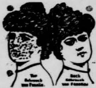
Na milijone dam