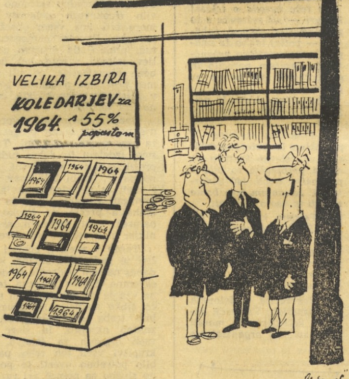
Kalkulacije so pokazale, da bomo s tako velikim popustom napravili odličen posel...