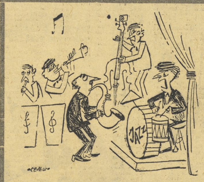
Si že znižal, v prosveti bodo imeli zdaj višje osebne dohodke! Kaj praviš, če bi šli nazaj v stroko?