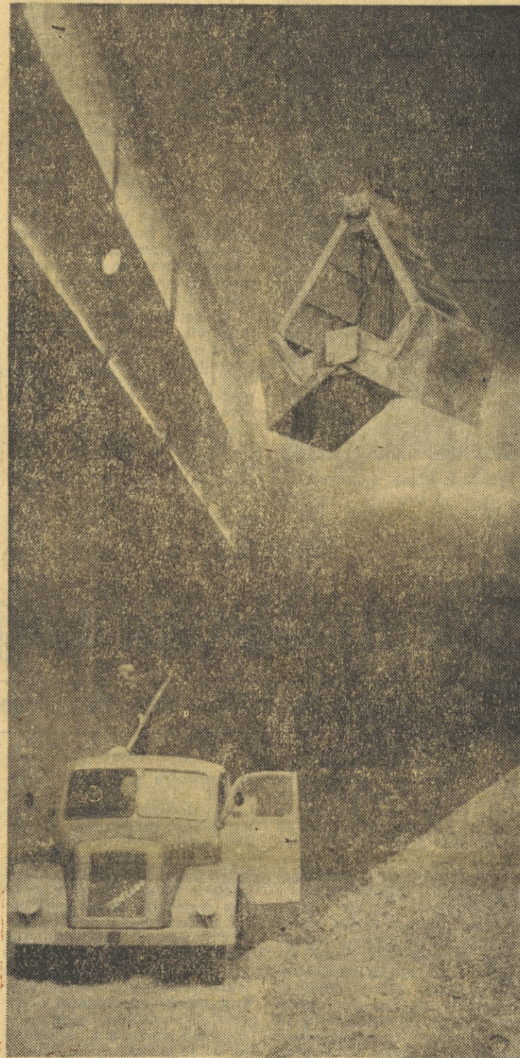
VARIACIJA NA TEMO: DELO

ČEPRAV PREMIKI, SE VEDNO VELIKO ZAVIRALNIH (Nadaljevanje na 2. strani)