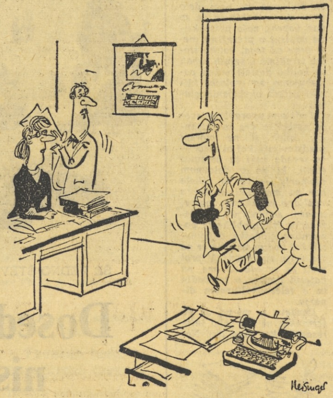
Hura, povpreček osebnih dohodkov v našem oddelku se je povišal za 2500 dinarjev - tovarišu Luki so namreč povečali plačo za 15 tisočakov!

PREJŠNJE KRIŽANKE VODORAVNO: 1. Tolstoj, 7. omika, e, 8. red, 9. Tit, 11. zlot, 13. vi, 14. 00, 15. ick, 17. obara, 18. satir, 20. kroj, 21. tl, 23. en, 24. Akra, 26. los, 28. vik, 29. omaka, 31. telurij. NAVPIČNO: 18. skelet.