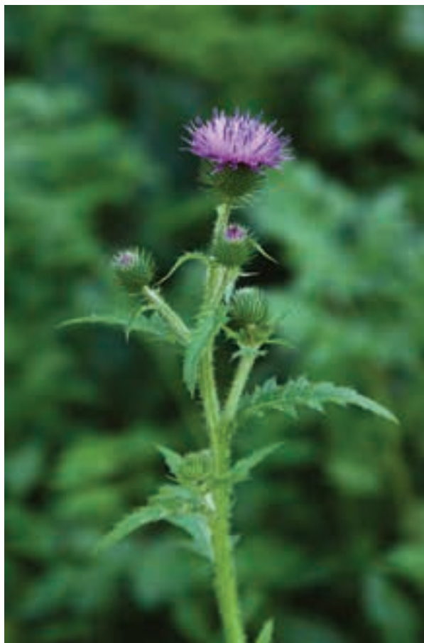
Slika 1a, b: Kodrasti bodak ( Carduus crispus ): (a) habitus in rastišče, (b) socvetje, Ukanc v Bohinju. Figure 1a, b: Carduus crispus : (a) habitus and habitat, (b) inflorescence, Ukanc in Bohinj.

Mentha longifolia . Leg. B. Zupan, 30. 7. 2013, leg. & det. B. Anderle, B. Zupan & I. Dakskobler, začetek avgusta (3. 8. in 13. 8.) 2013, herbarij LJS in fotografije avtorjev ter Petra Strgarja (slika 1a, b).