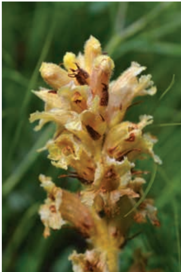
Slika 4a, b: Orobanche alsatica subsp. alsatica : (a) habitus in rastišče, (b) socvetje, pri Stopniku v dolini Idrijce.

Figure 4a, b: Orobanche alsatica subsp. alsatica : (a) habitus and habitat, (b) inflorescence, at Stopnik in the Idrijca valley.