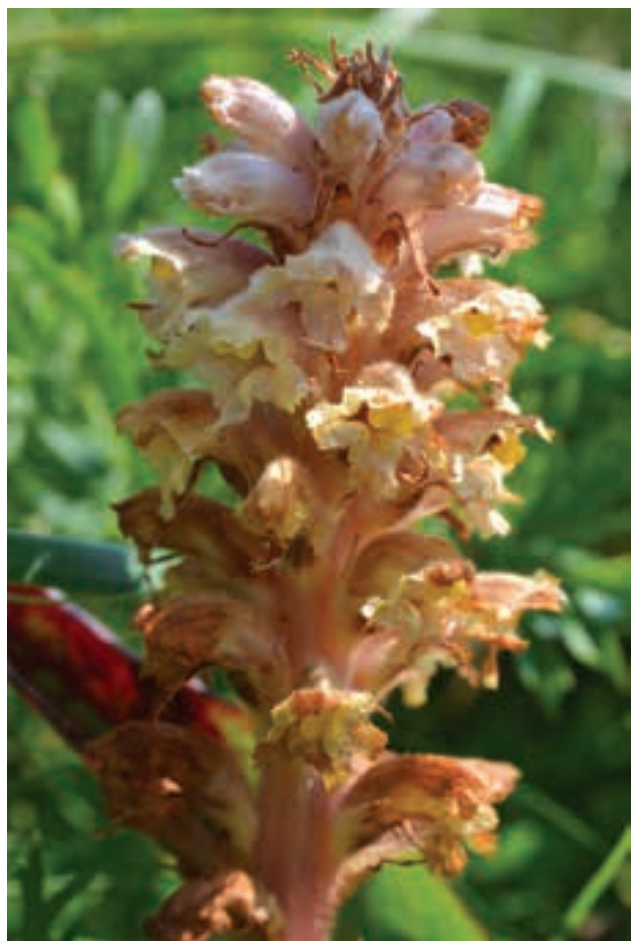
Slika 3a, b: Orobanche alsatica subsp. libanotidis : (a) habitus in rastišče, (b) socvetje, Nanos. Figure 3a, b: Orobanche alsatica subsp. libanotidis : (a) habitus and habitat, (b) inflorescence, Nanos.