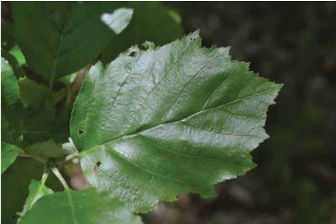
Slika 8a, b: Križanec med vrstama Sorbus aria in S. torminalis ( S. latifolia s. lat.): (a) habitus, (b) list, Vipavska brda nad Otoščami.