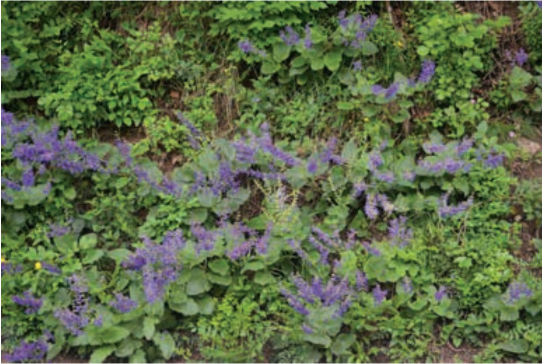
Slika 6: Saccardova kadulja na cestni brežini pri Stopniku v dolini Idrijce. Figure 6: Salvia pratensis subsp. saccardiana on the road bank at Stopnik in the Idrija valley.