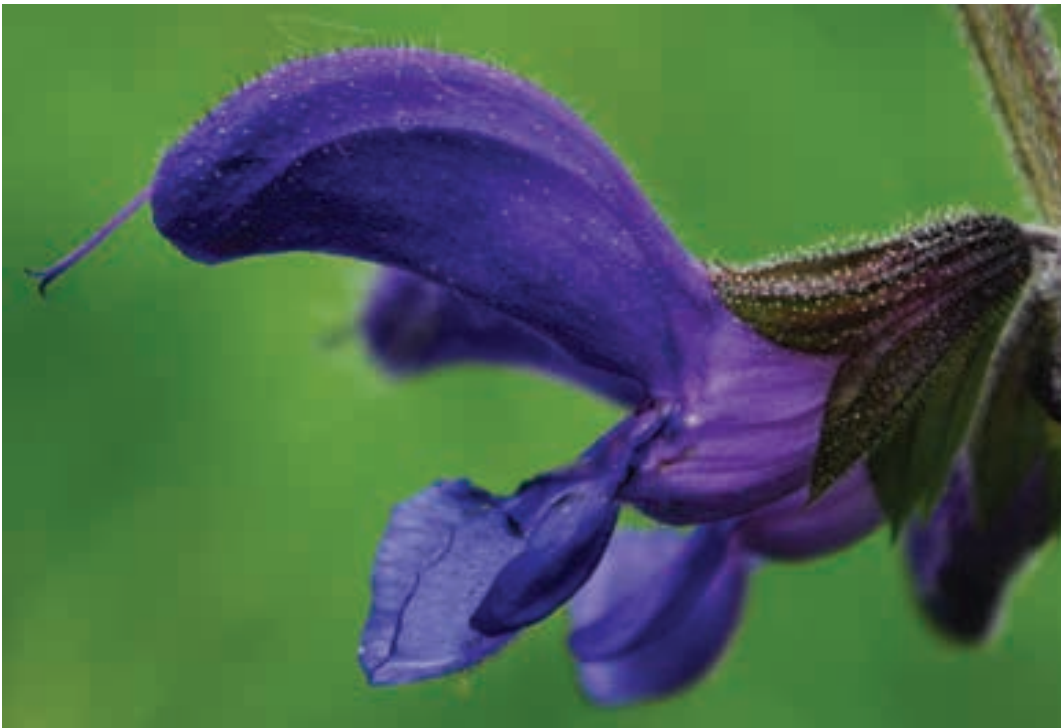
Slika 7: Cvet Saccardove kadulje je temnomoder in dolg 28–38 mm, Podkraj pri Hrastniku (Zasavje). Figure 7: The flower of Salvia pratensis subsp. saccardiana is dark blue and 28–38 mm long, Podkraj by Hrastnik (Zasavje).