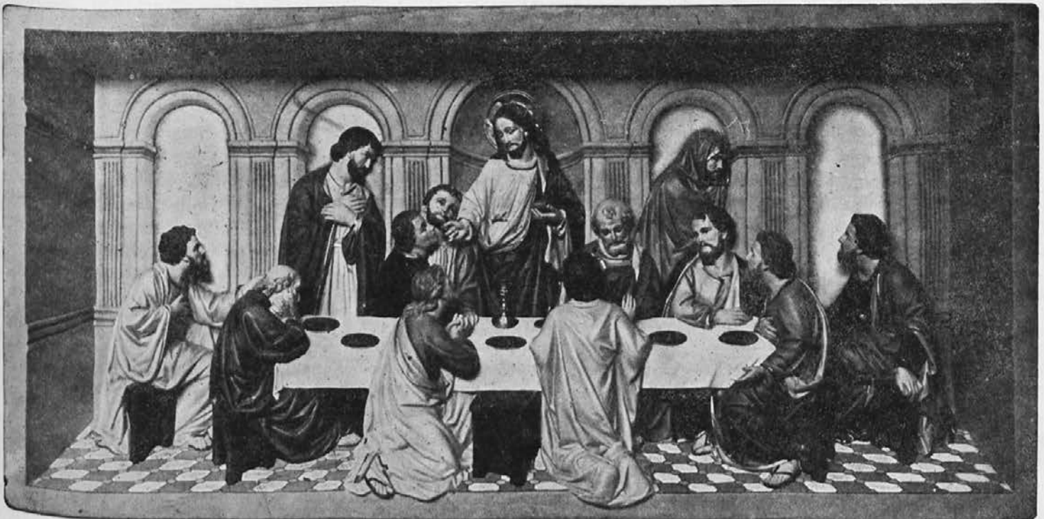
Dvakrat prvo sv. obhajilo.