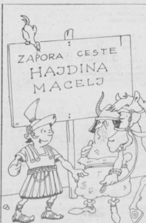
Kako ste to mislili, HERR TURISTIKUS, da pri vas ceste popravljajo zunaj turistične sezone?!