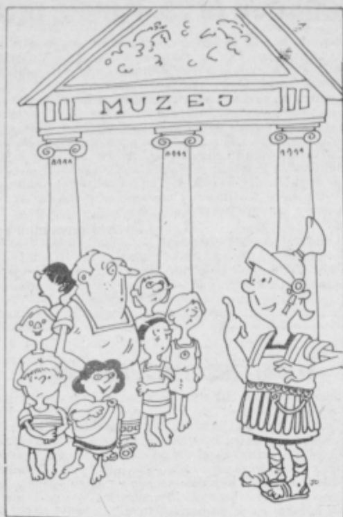
Poetovius: „Me nič ne briga, da niste dobili avtobuse kateri drugi dan. Če so muzeji po vsem svetu ob ponedeljkih zaprti, bodo tudi pri nas!“