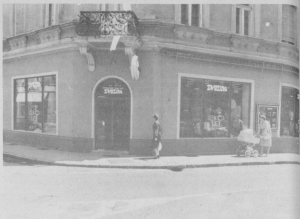
V prenovljeni in moderno urejeni prodajalni Zvezda so zagotovili specializirano ponudbo.