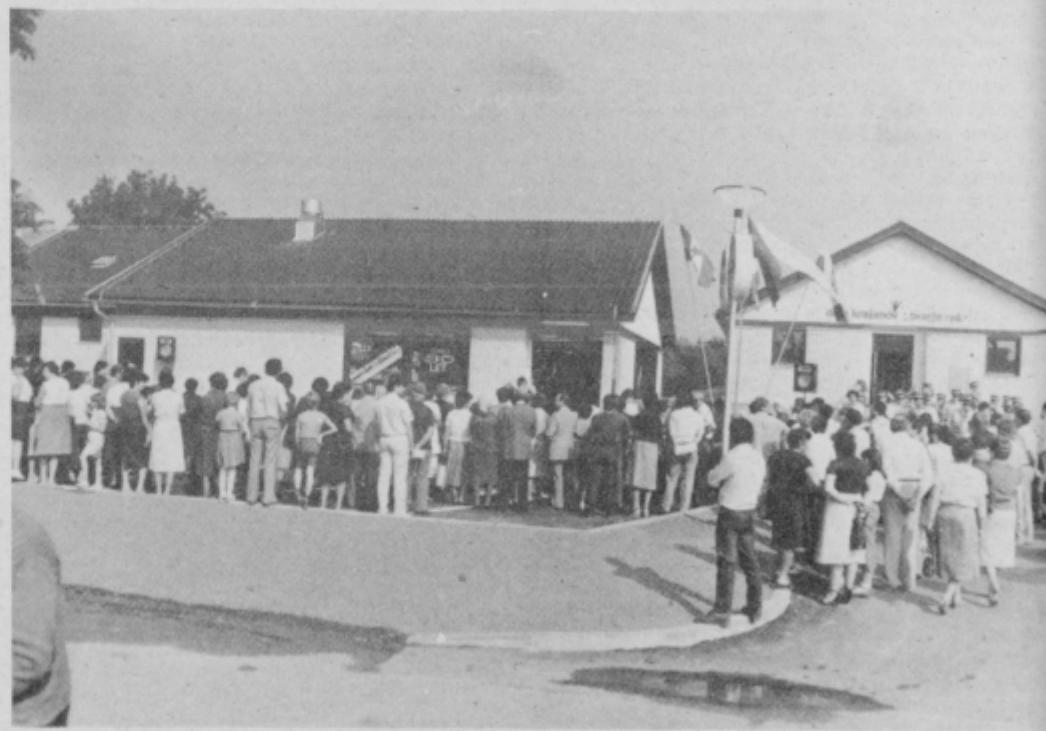
Delavci Emona Merkur so jubilej proslavili z odprtjem nove samopostrežne prodajalne Bratje Reš, ki je plod skupnih vlaganj delovne organizacije in krajevne skupnosti.