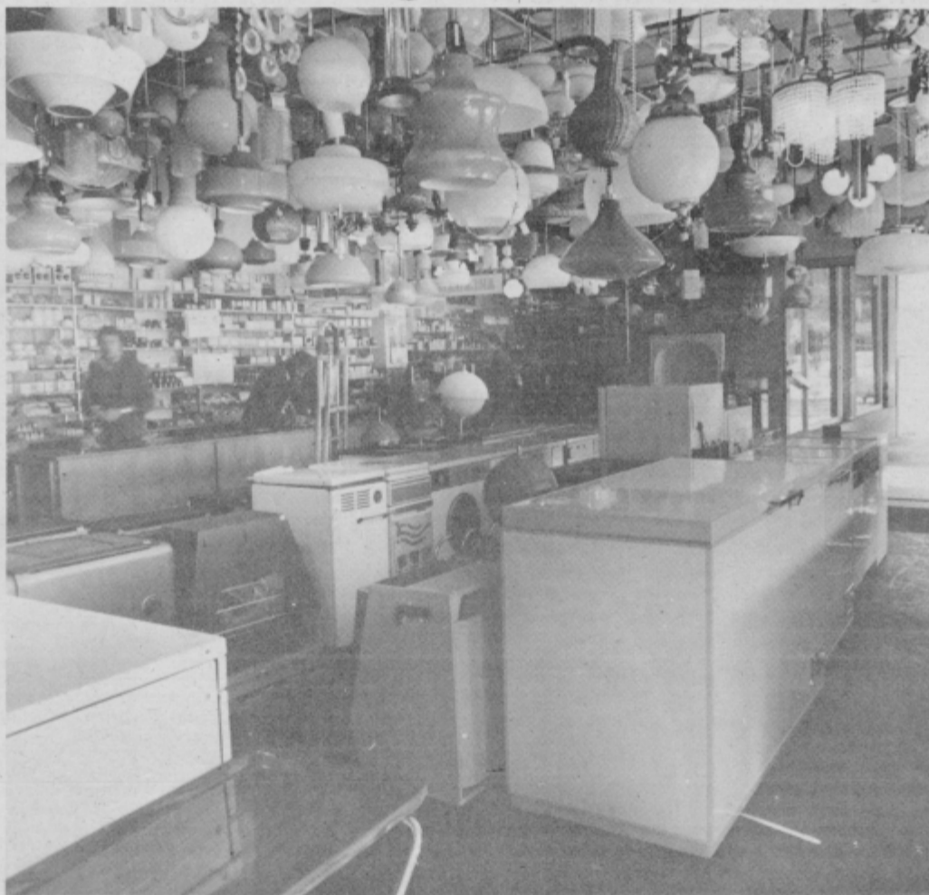
Prodajalna Tehnika je od nekdaj slovela po pestri in kakovostni ponudbi.

Vsem potrošnikom se zahvaljujejo za doseganje zvestobe in jih vabijo v svoje specializirane prodajalne. Njihovo geslo je še vedno — EMONA MERKUR Z VAMI IN ZA VAS.