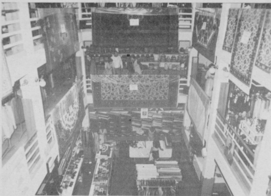
V prvi ptujski Veleblagovnici so bili štirje oddelki, kjer so potrošnikom ponujali raznovrstno blago. Danes je to znana Merkurjeva Tekstilna hiša.